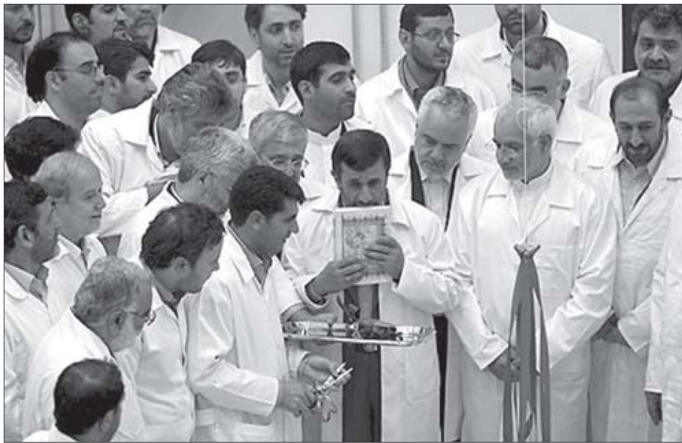
ხალხი ჰამენეისა და ისლამური რევოლუციის მხარეზე. გარდა ამისა, ირანის ოპოზიციაც კი მხარს უჭერს მშვიდობიანი ატომის პროგრამას, ეს ნაციონალური სიამაყის საგანია.

რეზერვუარის საჭირო ფინანსურ ელემენტად ჩათვალა, მაგრამ ამას ხელი არ შეუშლია პენტაგონისათვის, მხარი დაეჭირა და დახმარებოდა ირანს ბირთვული პროგრამის შექმნაში. შაჰი, ისევე, როგორც მისი მიმდევრები, ირანმუნებოდა, რომ ამგვარი პროგრამა ირანის ეროვნული უფლება იყო და ოცნებობდა ქვეყანაზე, რომელიც ელექტროენერჯის მნიშვნელოვან ნაწილს მთელი რიგი ატომური სადგურებიდან მიიღებდა. 1970-იან წლებში ამერიკული ენერჯეტიკული კომპანიის ჯგუფი ამგვარ ფორმულირებას აკეთებდა: „ირანის შაჰი მსოფლიოში ნავთობის უდიდეს რეზერვუარზე ზის და კიდევ სადგური ქვეყანაში ელექტრომომარაგების ნარეზერვუარისათვის. მან იცის, რომ ნავთობი მთავრდება და მასთან ერთად მთელი ეპოქაც“. სხვაგვარად რომ ვთქვათ, სწორედ აშშ-ის ბირთვულმა პროგრამამ დაუდო სათავე ირანულ ბირთვულ პროგრამას, რომელიც ასე სწულს ახლა ვაშინგტონს.