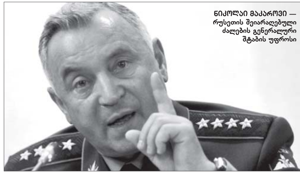
ნიკოლაი მაკაროვი — რუსეთის შეიარაღებული ძალების გენერალური შტაბის უფროსი

ახლა თვალსაჩინოა „ევროპულ ფლანგს“ შევავლოთ. დავეუშვათ, რომ რუსეთმა მართლაც გააძლიერა დაჯგუფება კალინინგრადში, ამერიკელებმა (საპასუხოდ) დამატებითი საშუალებები განალაგეს პოლონეთში, რუსებმა (საპასუხოდ) გააძლიერეს დასავლეთის მიმართულება ზოგადად, წინ წაიწიეს ბელარუსში, რადგან ამის გარეშე კალინინგრადის გაძლიერებას, სტრატეგიული თავსაზრისით, განსაკუთრებული აზრი არ აქვს, ამერიკელებმა (საპასუხოდ)... ალბათ, გასაგებია, სადამდე შეიძლება მივიდეს ყოველივე ეს საბოლოო ჯამში — „ევროპის მოტაცებამდე“, როდესაც ევროპა, რომელიც „ცივი ომის“ შემდეგ ჯერაც ნორმალურად ვერ ამოისუნთქა, კვლავ ორი გიგანტის მიერ გაჩაღებული თამა-