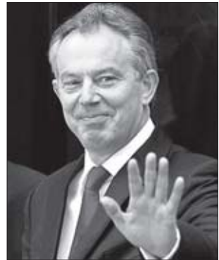
ტონი ბლერი ბრუნდება

უცნაურია, მაგრამ საქართველო მსოფლიოში ერთ-ერთი იშვიათი ქვეყანაა, რომელიც „ცივი ომის“ დროინდელი პოლიტიკური მითოლოგია კვლავინდებურად დომინანტურია. ის ფაქტი, რომ გლობუსზე რუსეთისა და აშშ-ის გარეშე არსებობენ სხვა ქვეყნები და თანამედროვე გეოპოლიტიკურ თამაშში ორ მხარეზე მეტია ჩართული სათვალავში, როგორც წესი, არ მიიღება.