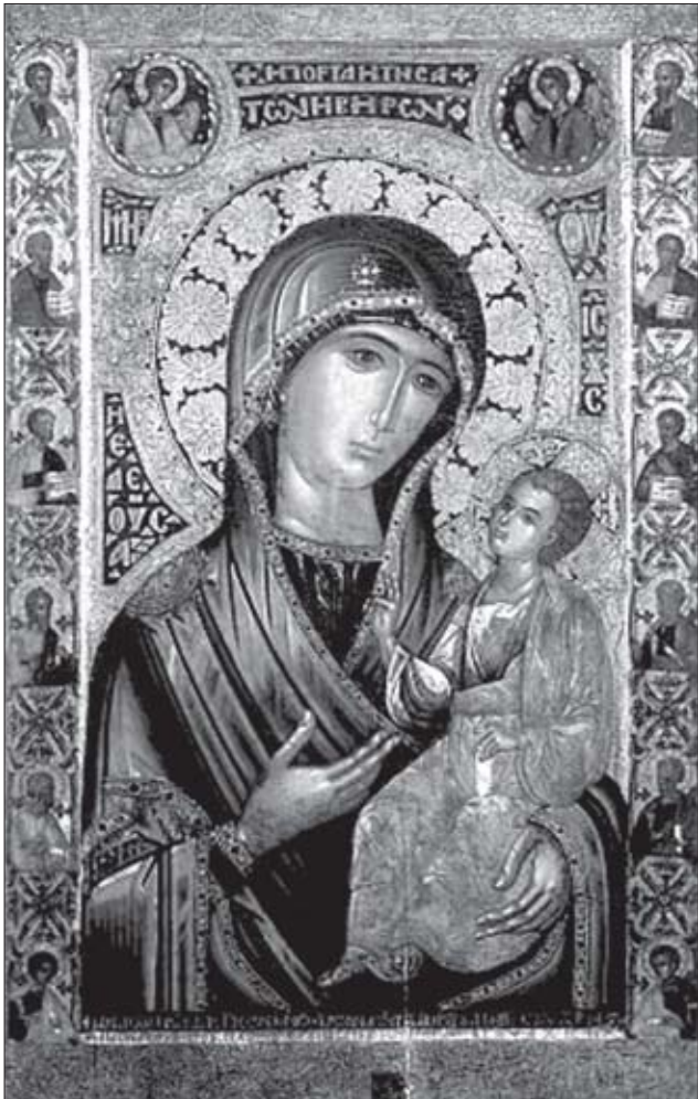
«ვიღია ამ სავანეში იხილვა ჩვენი ხატი, არ მოგაკლდათ თქვენი ჩვენი ქის გაღლი და წყალობა»