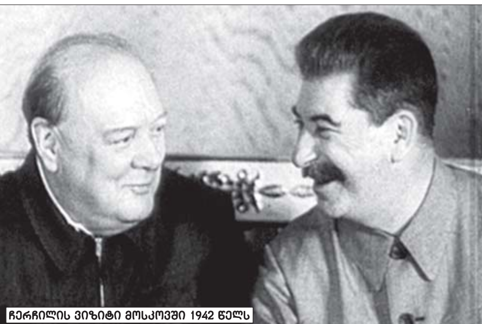
ჩერჩილის ვიზიტი მოსკოვში 1942 წელს

ამ სიტყვებში შეიძლება შევერთოთ მითითება იმაზე, რომ ვერმანების შემდგომი წარმატებების შემთხვევაში, რუსებმა შეიძლება ურალის იქით დაიხიონ, და მაშინ გერმანიის არმიები დასავლეთისკენ დაიძრებინან. საპასუხო ბარათში ჩერჩილმა, კერძოდ, შეახსენა თავისი, გაზაფხულზე განცხადებული, დათქმა: „ჩვენ არ შეგვიძლია არავითარი დაპირების მოცემა“. მაშასადამე, ეს ათავისუფლებს მას პასუხისმგებლობისგან, იმის გამო,