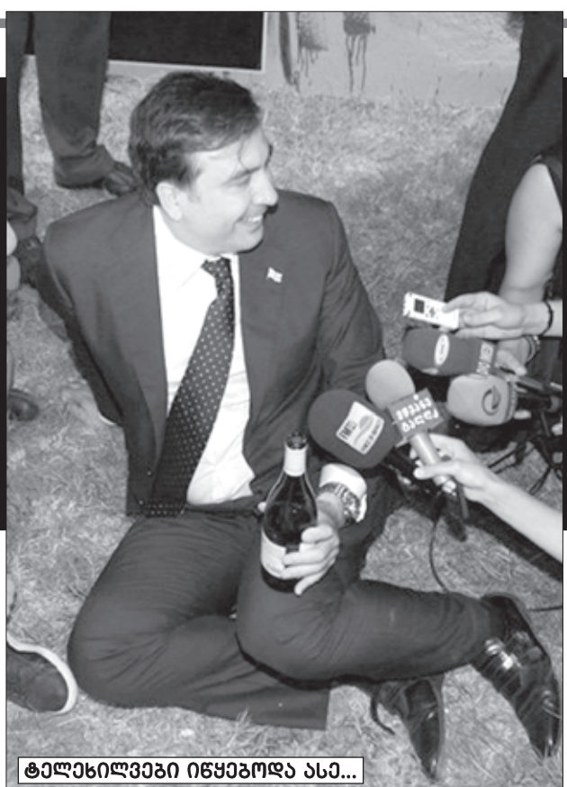
ტელევიზიები იწყებოდა ასე...

— შვილებო, მათ შორს ვერ გავიხედე. ალასანია მაშინ ახალი ჩამოსული იყო შტატებიდან. ეტყობა, ამერიკელებმა ურჩიეს, ეცადეთ, მშვიდობიანი გზით შეცვალოთ ხელისუფლება. ნიჟინა, ვაშაყავაძით ახასიათებთ მოუთმანლოზა. მე, თუ ნიჟინა მიმართავს, მცხეთაში მიუთმანელი ვარ. იმდენად მისთვის მარტოვანი ვარ. იმდენად მისთვის მარტოვანი ვარ. — შვილებო, მათ შორს ვერ გავიხედე. ალასანია მაშინ ახალი ჩამოსული იყო შტატებიდან. ეტყობა, ამერიკელებმა ურჩიეს, ეცადეთ, მშვიდობიანი გზით შეცვალოთ ხელისუფლება.