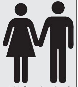
გრამის წყალობით ქვეყანა მთელი ისტორიის მანძილზე ყველაზე თავგაბანულთაობას გახდოდა, მაგრამ განათლების სამინისტრომ მშვიდად უპასუხა ამ განცხადებების ავტორს, რომ პროგრამის დახურვას არ აპირებს. mixednews.ru

აქცხდა, რომ მისი სამინისტრო ყველაფერს გააკეთებდა პრომოტივობისთან დაკავშირებული დიფერენცირების აღმოსაფხვრელად. ანალოგიური პროგრამა უკვე მოქმედებს შტატ ვიქტორიაში, მას „უსაფრთხო სკოლების კოალიცია“ ჰქვია და მხარს უჭერს სექსუალურ მრავალფეროვნებას. მთავარი გამოწვევაა მემორანდუმის მიხედვით, რომელიც მიმართულია მემორანდუმის მიხედვით, რომელიც მიმართულია მემორანდუმის მიხედვით.