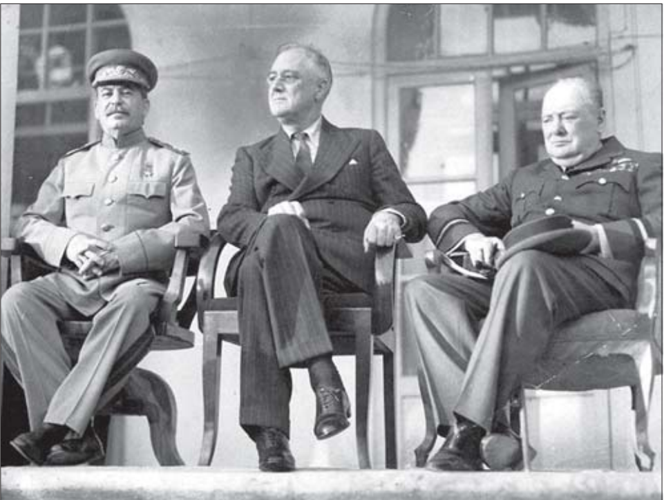
უინსტონ ჩერჩილი: აქ ჩვენ, ყველანი, ქართველების ხელში ვართ!

ბენერალ ვარლამ კაკურაის დღიურიდან: „დაახლოებით აგვისტოს 20 რიცხვებში, როდესაც სამსახურებრივი საქმეების გამო ვიმყოფებოდი ჭიათურაში, მივიღე დეკრეტი მინეროლოგიის დაუყოვნებლივ ჩამოსვლისკენ თბილისში. აქ მე წავიკითხე დაშიფრული ტელეგრამა, გამოგზავნილი მოსკოვიდან ჩემს სახელზე: „ამის წავიხვისთანავე, ჩეკისტების ოპერატიული მცირე ჯგუფით გაემგზავრეთ ჯულფაში (აზერბაიჯანი) იმის გათვლით, რომ 24 აგვისტოს 24:00 საათზე ჯარების შეტევა გახსნათ პაკეტი თქვენს სახელზე და იმოქმედოთ პაკეტში არსებული დოკუმენტების მიითებით“. ...მიუხედავად იმისა, რომ ამიერკავკასიის ფრონტის ყველა უმაღლესი წოდების მქონე პიროვნებები მე კარგად მიცნობდნენ, მათ შორის სამხედრო საბჭოს წევრი — მირჯაფარ ბაგიროვი (აზერბაიჯანის ცკ პირველი მდივანი), რომელიც, ასევე, იმყოფებოდა ჯულფაში, ვერავინ ვერაფერი კონკრეტული ვერ მითხრა, ყველა მოკლედ მპასუხობდა — 24:00 საათ-