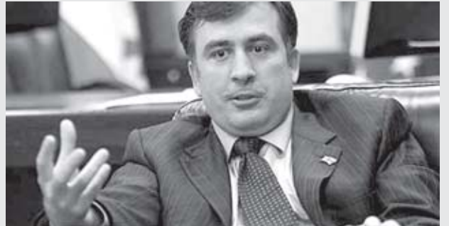
დამაზებებს ემსახურებოდა, მაგრამ ახალი ბიუჯეტის გამო, რაც პრეზიდენტის ადმინისტრაციისთვის ხარჯების შემცირებას ითვალისწინებს, იძულებული ვართ, განათება გამოერთოთ, — აღნიშნულია განცხადებაში.