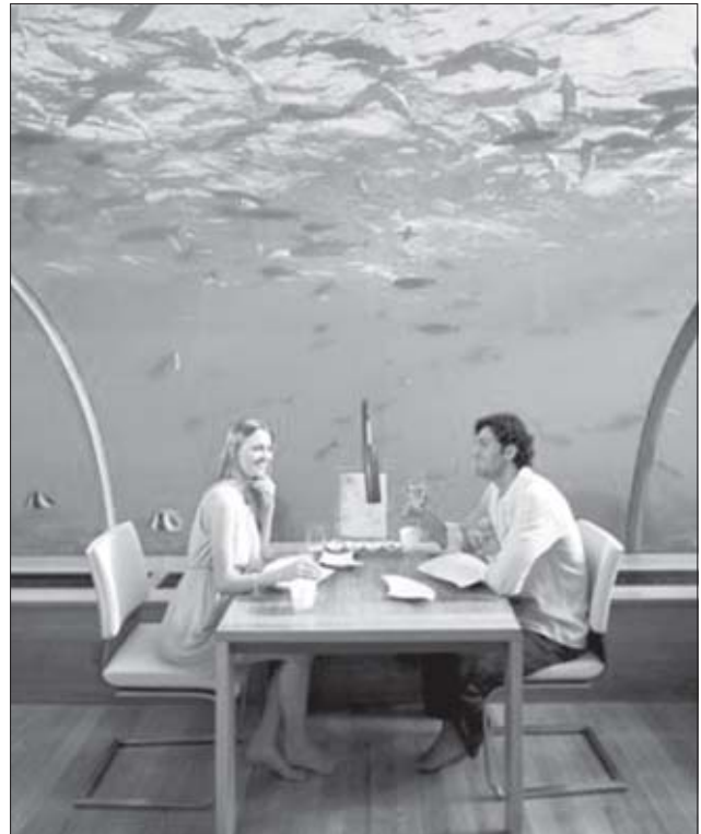
აქ შეიძლება გაიმართოს ქორწილი, კერძო ღონისძიებები, ხოლო შესაბამისი თანხის გადახდის შემთხვევაში, რესტორანი, შესაძლოა, წყალქვეშა საძინებლად იქცეს.

მალდივის კუნძულებზე უნიკალური და ორიგინალური რესტორანია. ის წყალქვეშა, ზღვის დონიდან 4.87 მეტრის სიღრმეშია განთავსებული. რესტორანი სახელად „იტპა“ სტუმრებს წყალქვეშა სამყაროს უპრეცედენტო ხედს სთავაზობს. თქვენ შეგიძლიათ დატკბეთ ზღვის ბინადრების ცხოვრებით და ამასთან, მიირთვათ ვახშამი. ეს უნიკალური დანესებულება კურორტ Conrad Maldives Rangali Island-ის წყლებშია. ეს მსოფლიოში ერთ-ერთი ყველაზე უჩვეულო რესტორანია. ადგილობრივ ენაზე „იტპა“ მარგალიტს ნიშნავს. მშენებლობის დროს ძირითად მასალად გამჭვირვალე აკრილი გამოიყენეს. რესტორანს ერთდროულად 14 სტუმრის მიღება შეუძლია. შიდა სივრცე სიგრძეში — 9, ხოლო სიგანეში 5 მეტრია. ეს უნიკალური დანესებულება არქიტექტორ ჯონ მერფის დაპროექტებულია. რესტორანში შესვლა სპეციალური სპორტული კიბითაა შესაძლებელი. კიბე ნაპირს უკავშირდება.