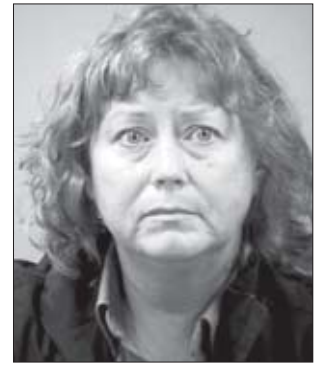
იყო ლატარეის ბილეთების შესაძენად. საკუთარი გატაცებით შეილას ძალიან უნდოდა ყურადღების მიპყრობა. ცრუ ჩვენების მიცემის გამო იუბენკს კანონის წინაშე პასუხისმგებელი უნდა გახდეს.

მობილში დატოვა. თუმცა გამომძიების შედეგად პოლიციამ მომხდარის ნამდვილ მიზეზს მიაგნო. ბენზინგასამართი სადგურის სიახლოვეს, სადაც იმ დღეს შეილა ავტომობილი შეინძნეს, სათვალთვლო კამერების ჩანაწერმა დადასტურა, რომ სავარაუდოდ გატაცების მომენტში შეილა ლატარეის ბილეთებს ყიდულობდა. მოგვიანებით სამხილი შეილას ჩანთაში აღმოჩნდა. ბოლოს შეილა იძულებული გახდა, ელიარებინა, რომ იმ დღეს დილიდან ფიქრობდა, რომ ყველაზე იღბლიანი დღე