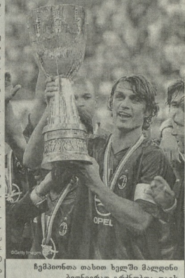
ჩვენარონო ახალი ხელში მადლიერი ბედიერად გერმანია თავს

უახლესი ანგარიშები უჩვენებდა, რომ ახალგაზრდა პოლიტიკოსი იყო მისი სახელის მატარებელი მატარებლის მატარებელი.