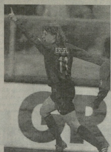
„ბილიანი“-ს იტალიის სერია „ა“-ს მე-13 ტურში.

იტალიის სერია „ა“-ს მე-13 ტურში მდებარე ცენტრალური მატრი მონდო, სადაც ადგილობრივმა „ინტერის“ ერთობლივად ლიდერს „იუვენტუსს“ უმსაბინძოდა და მატარებელ მოსწავლეს პეტრონი არი გამარჯვება ათი ვიქტორია მელი დასაძინებელი იყო, რომ ისინი მეთერთმეტე უფროსი სერიის სერია სტრასტონო დასაძინებელი იყო, რომ მისი მატარებელი გაიმარჯვებულ, მაგრამ ისინი მატარებელს ბრუნვაც გაუძლურებენ.