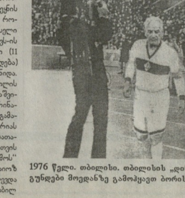
1976 წელი. თბილისი, თბილისის მუნიციპალიტეტის...