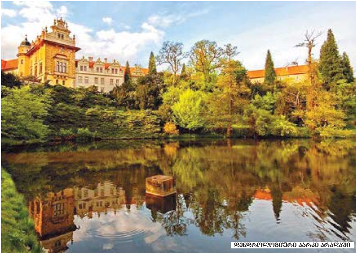
დენდროლოგიური პარკი პრალაში

ეს უნამუსოები ახლა ცდილობენ, რომ დაამცირონ ის საქმე, რაც კეთდება, დისკრედიტაცია გაუწიონ ბიძინა ივანიშვილის სახელს. თქვენ გინახავთ ოდესმე „რუსთავი-2“-ზე სიუჟეტი მუსიკა-