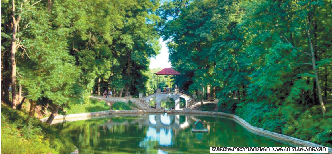
დენდროლოგიური პარკი უპრაიანში

რედაქციისაბან: შეიძლება მოატყუო აწმყო, მაგრამ მომავალს ვერ მოატყუებო, — ნათქვამია. დღეს „ნაციონალიზმი“ და მისი ნაბიჭვრები, დამოუკიდებელ პოლიტიკურ პარტიებს რომ ეახიან თავიანთ თავს, კერძო თუ მოსყიდული საინფორმაციო საშუალებებით, მოსყიდული ფურნალისტებით, მოსყიდული არასამთავრობო ორგანიზაციებით საქართველოს მოსახლეობის მოტყუებას ცდილობენ, მაგრამ გავა სულ მცირე ხანი, 20–30 წელიწადი და მთელი სისრულით წარმოჩინდება გრანდიოზული მასშტაბები იმ საშვილთაშვილო