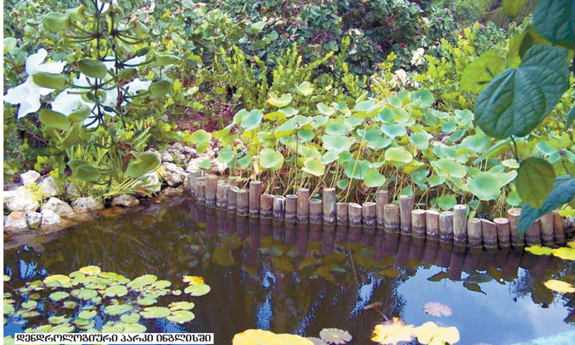
დენდროლოგიური პარკი ივანეჯიკში

მრავალწლიანი იჯარით გაცემის ნებართვები. წლების განმავლობაში ნაციონალებს სხვადასხვა ქვეყნის მოქალაქეებსა და იურიდიულ პირებსზე გაცემული ჰქონდათ 40–49 წლიანი იჯარით ტყით სარგებლობის ნებართვები. ფაქტობრივად, უცხოელებისთვის საკუთრებაში ჰქონდათ მიცემული საქართველოს ტყეები. ჩვენ ეს პროცესი შევაჩერეთ. სხვათა შორის, ბიძინა ივანიშვილი იყო მაშინ პრემიერ-მინისტრი, როცა ამ კანონის მოქმედება შეაჩერა პარლამენტმა.