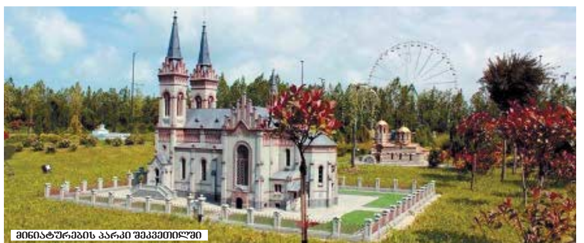
მინიატურების პარკი შაკვეთილში

ჩვენს დენდროლოგიურ პარკში უნიკალური ჯიშის ხეები დაირგვება. მსოფლიოს სხვადასხვა კუთხიდან 150 სახის იშვიათი ჯიშის ხეს ჩამოიტანენ. მათ შორის აფრიკიდან და აზიის ქვეყნებიდან. ჩამოიტანენ უნიკალურ სექქოიას,