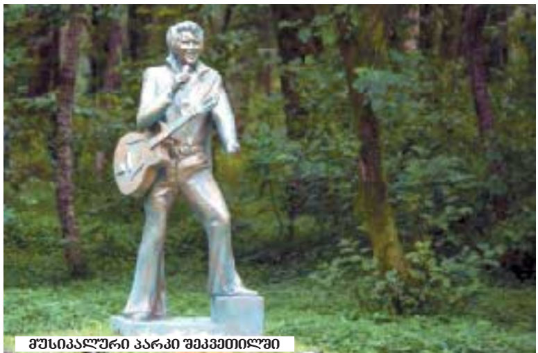
მუსიკალური პარკი შაკვეთილში

ბიძინა ივანიშვილმა ყოველივე ეს გააკეთა და არუქა საქართველოს.