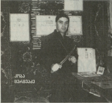
საქართველოს კარატელოს ეროვნული ფედერაციის კლუბმა „შოდანმა“ საგაზაფხულო ტრადიციული ტურნირი ბრწყინვალედ ჩაატარა, რომელშიც 250-ზე მეტი სპორტსმენი ასპარეზობდა.

„შოდანის“ ტურნირმა ძალიან მოკლე ხანში დიდი პოპულარობა მოიპოვა, რადგან კლუბმა გამარჯვებული კარატისტები უცვლელად ფულადი პრემიებით დააჯილდოვა. ეს უპირველეს ყოვლისა ქართველი სპორტსმენებისათვის საკმაოდ დიდი სტიმული იქნება, რაც თავისთავად კარატეს პოპულარობას კიდევ უფრო გაზრდის. ტურნირის ორგანიზატორულ-სპორტულმა დონემ ამკარად მოლოდინს გადაატარა, მინდა დიდი მადლობა გადავუხადო კლუბ „შოდანის“ პრეზიდენტს