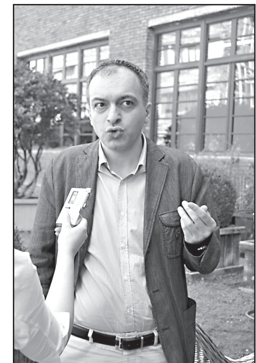
რი დაძალებისა და თავდაპირველი გარეშე, სამწუხაროდ, ჯერ ვერ ვხედავ პოლიტიკას, დავანახოთ მათ, რომ რეალურად მათ და არა ჩვენ წინააღმდეგ მუშაობს.

— რუსეთი ასე მარტივად ჯარებს არ გაიყვანს. რუსეთის პოზიცია რა არის — მე არაფერ შუაში ვარ, თუ გინდათ, ელაპარაკეთ ჩვენს მიზანს, აფხაზებსა და ოსებს რეალურად დაეხმას, დაეხმას, თუ რა პერსპექტივა აქვთ მათ ცალკე და რა პერსპექტივა აქვთ ჩვენთან ერთად ერთიან სახელმწიფოში. ეს უნდა დაეხმას ყოველგვარ