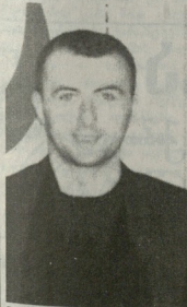
თასი საპარტიველოში უნდა ღარივს

საბავშვო ცენტრი ა. ნარბეულიძის ქ. ი. ბერიძის ქ.