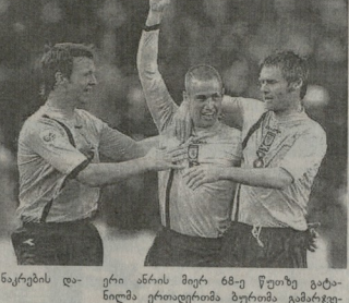
ერთი არის მიერ 68-ე წელიწადიდან მორეგულატორებსა და სპორტსმენებს ნაკრების მოუტანა — 1-0.

როსტოვის მთავრობის მიერ 2006 წლის მსოფლიოს შესარჩევ ეტაპის მორეგულატორები გაიხარა. ევროპის ხონის პირველი ჯგუფში ჩვენი ნაკრები, როგორც მოსალოდნელი იყო, 4-1 დაამარცხა სმოილა გუნდი. გამარჯვებულმა ბურთები გაიტყუნა: ორი — პოლკა, თითო — პარენა და ზაროვა. ფინალშია უფრო დიდ სკოლიანი (51) მოედის მკვიდრებმა, რომლებმაც სმოილა გუნდის მიმართ კარგად იმუშავეს — აღწერის ნაკრების დასაწყისში.