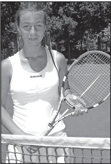
„დინამოს“ კორტზე დათაშენიკურად „რენას და დატოს“ თასის გათამაშება...