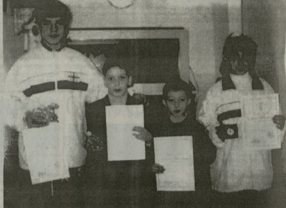
საქართველოს კარატე-დოს ეროვნული ფედერაციის წევრები და მონაწილეები ტურნირში.