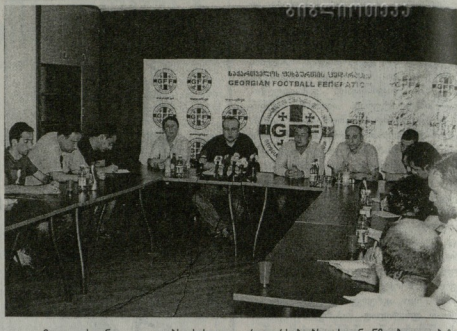
მოლა მათი თხოვნა — კლეს სასკოლო შენახრდა...