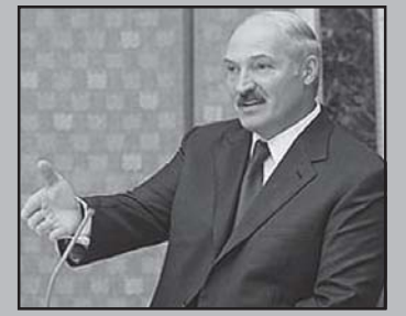
პრემია: ლუკაშენკო, ვინც მოსკოვშია გააშავა, იმდენს დასაბრუნებს დასაბრუნებელი

ვეროსაბჭო სთავაზობს ბელარუსს რეფორმის განხორციელებას ფინანსური დახმარებისა და ვეროინტეგრაციის საფასურად. ექსპერტებს მიიჩნიათ, რომ ლუკაშენკო, ვინც დაკარგა მოსკოვის ეკონომიკური მხარდაჭერა, გახდება უფრო თვინიერი, მაგრამ ვეროკავშირის რეფორმების ნაცვლად მიიღებს მხოლოდ მათს იმიტაციას.