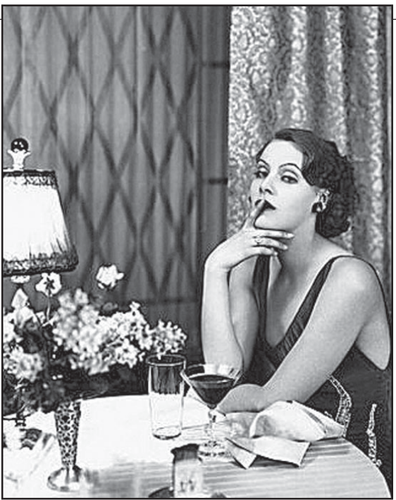
მოამზადა გიმი გამრეკელმა

ვუდში, ჰქონდა სულ ორი კაბა, ორი შლაპა, ერ-თადერთი თეთრბული და... არ ჰყავდა არც ერ-თი მემოგარი“.