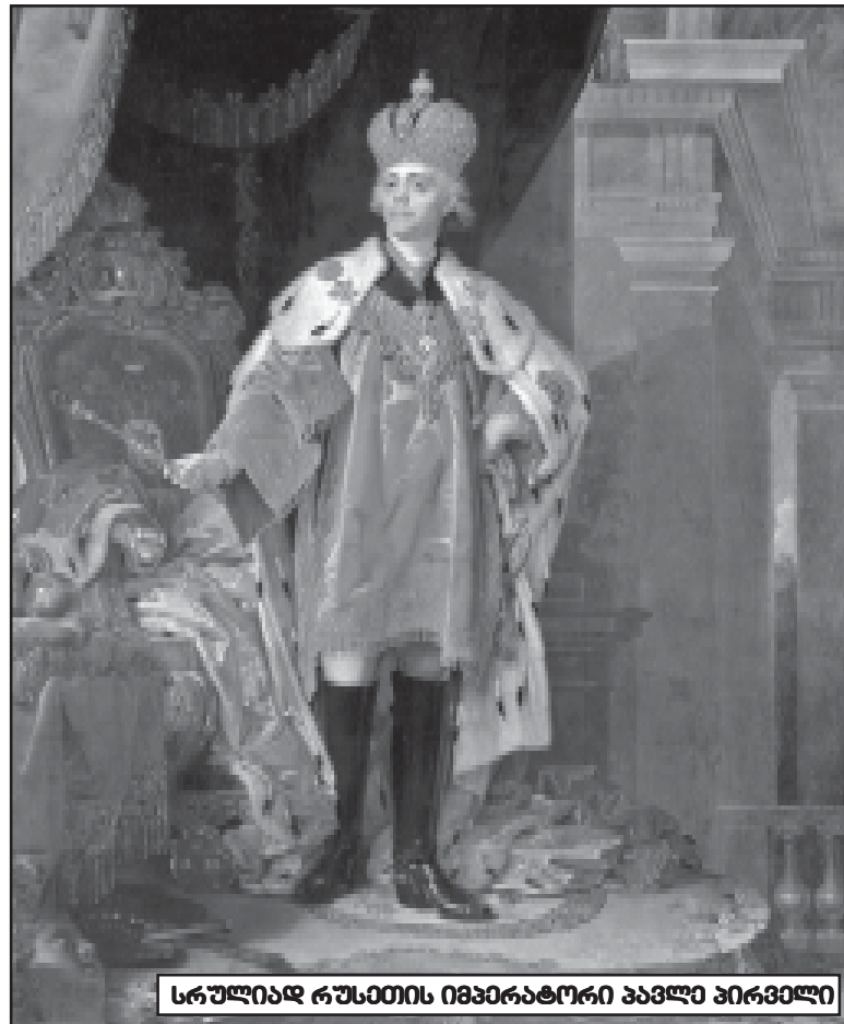
სრულიად რუსეთის იმპერატორი პავლე პირველი

პავლე I ჯოხის სისტემით მართავდა რუსეთს და ამ ჯოხს, ხშირად ოფიცრებსაც ურტყამდა. თავისი ოჯახისათვის ხომ ნამდვილი დესპოტი იყო. დედოფალს მონაზონად აღკვეცას უპირებდა, უფროს ვაჟებს – ალექსანდრესა და კონსტანტინეს – დაპატიმრებას, მინის-