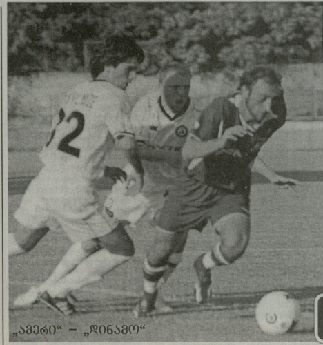
„ამერი“ - „ინანო“

როგორც ვინც ვიცნობთ, კალათბურთის ელიტური სპორტის სფეროში ტურნირების ჩატარებასთან დაკავშირებით საქართველოს სპორტის ფედერაციამ განაცხადი გააკეთა. საქართველოს სპორტის ფედერაციამ განაცხადი გააკეთა.