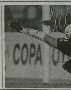
საქართველოს სპორტის ფედერაციამ განაცხადი გააკეთა.

საქართველოს სპორტის ფედერაციამ განაცხადი გააკეთა. საქართველოს სპორტის ფედერაციამ განაცხადი გააკეთა.