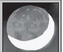
ამოდის 05.15 ჩადის 19.05