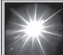
ამოდის 05.04 ჩადის 19.08

სხანება ღირსი გიორგი გაგნებლის (ათონელისა, 1033ქ, წმ. მოციქულ დიკონთა 70-თან განპროსორისი, ნიკანორისა, ტიმონისა და პარმენისა; წმ. მოწამეთა: იულიანისი, ესტატისი და აპაკისა.