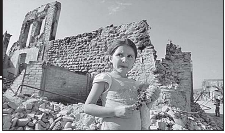
ძნელია შეეფასო, მაგრამ იმ რეალობაში, რომელშიც ვიმყოფებით, პრობლემის გადაწყვეტის თვალსაზრისით რა პერსპექტივებზე შეიძლება საუბარი?

— დასავლეთის ვერც ერთ ქვეყანას საპარტიოლოს პრობლემებისადმი დინამიკურად ურავსა... მართალია მოსახლეობისთვის ალტერნატივის საფუძველი არ უნდა იყოს.