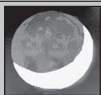
ამ დღის 07.52 ჩაბნევა 20.04