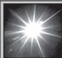
ამ დღის 05.06 ჩაბნევა 20.06

სწინებავს აღმსარებლის ცოტნესი, სპარტოველისთვის თავდადებული (დღიანი, XIII; 70-თაბანთა მოციქულთა: შილასი, სილოვანესი, კრისპანტისა, ეპენეტოსი და ანდრონიკოსი (ქ; მოწამისა იონანე მხედრისა (ქ; მოწამითა: პოლიქრონისა, გაბრილონისა ეპისკოპოსისა, პარმენ, ელიმ და ძრისოტელ სუცნეთა, ლუკა და მუკო დიაკონთა, ანდონი და სენისი სპარსეთის მთავართა და მოწამითა ოლიმპისა და მადონისი (დღიანი, 25); გლვდელმოწამისა ვალენტინა (უალენტინა ეპისკოპოსისა და სათნო მოწამითა მისთა მოწამითა: პრკოპიუსისა, ეფიზინსა და აპოლონისა და მართლისა აპუსტოლისა (დღიანი, 273).