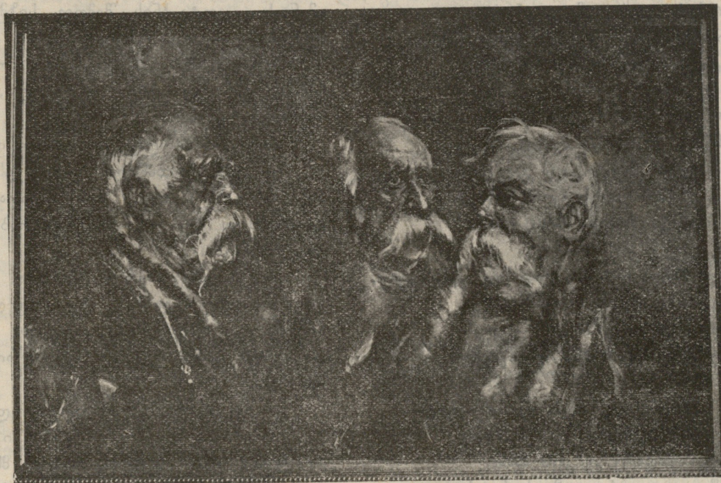
მოქალაქეთა ტიპები, გ. ვაბაშვილის ნახატი.