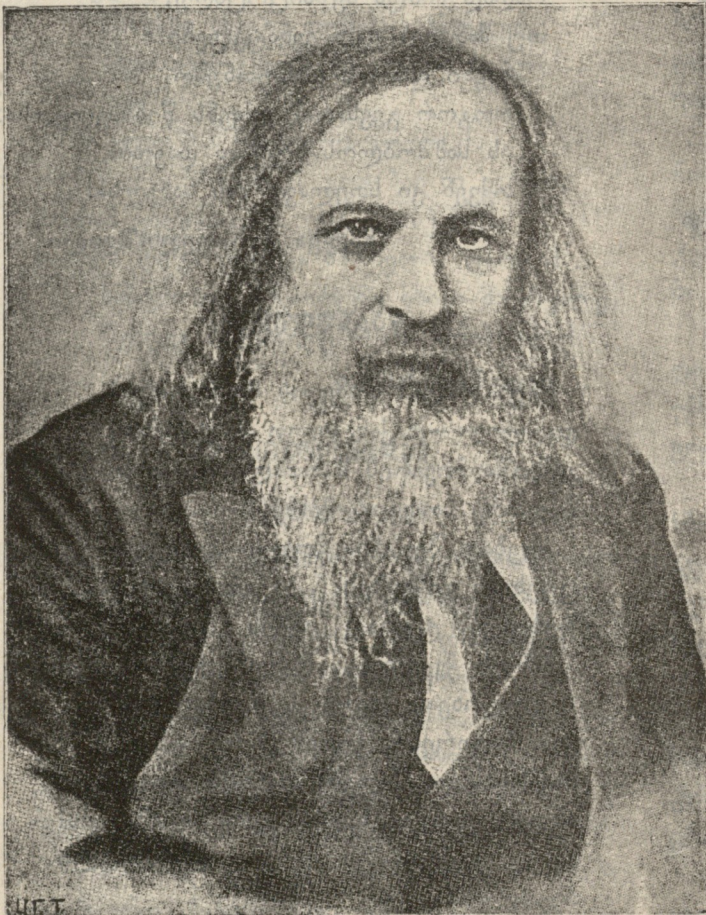
ცნობილი მეცნიერი პროფესორი მენდელეევი. (გარდაცვალების გამო)