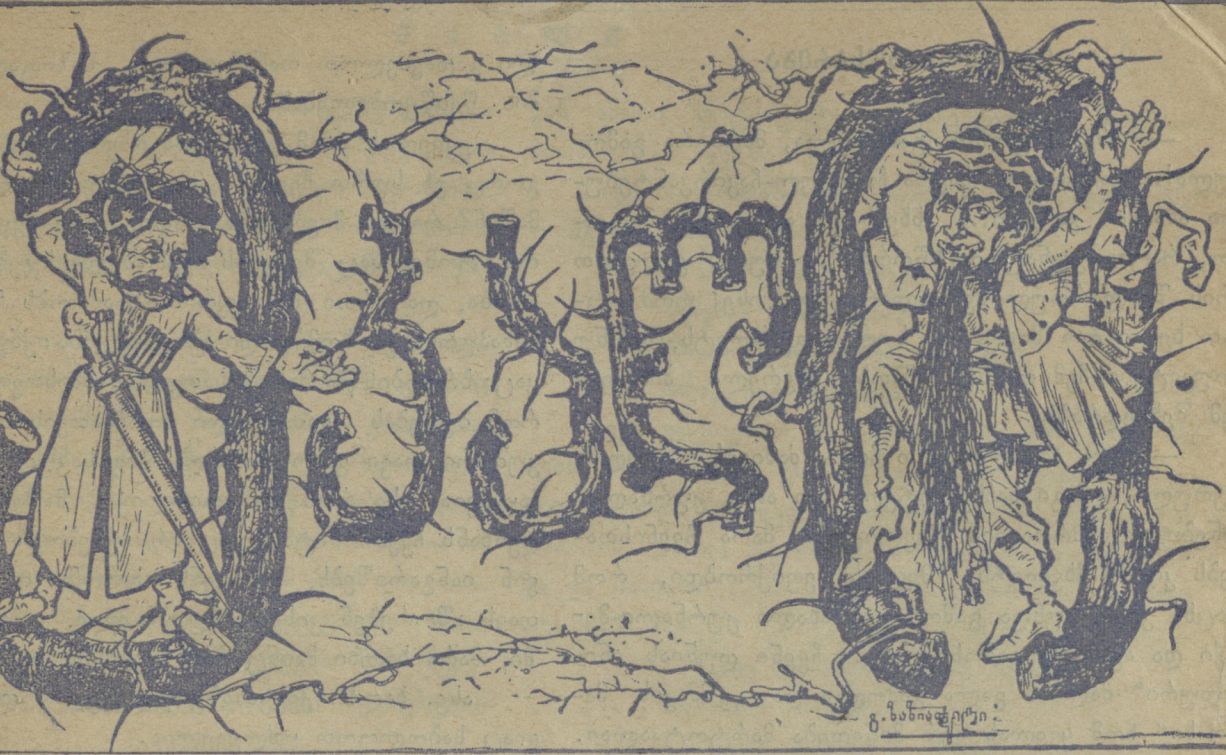
გ. გ. გ.