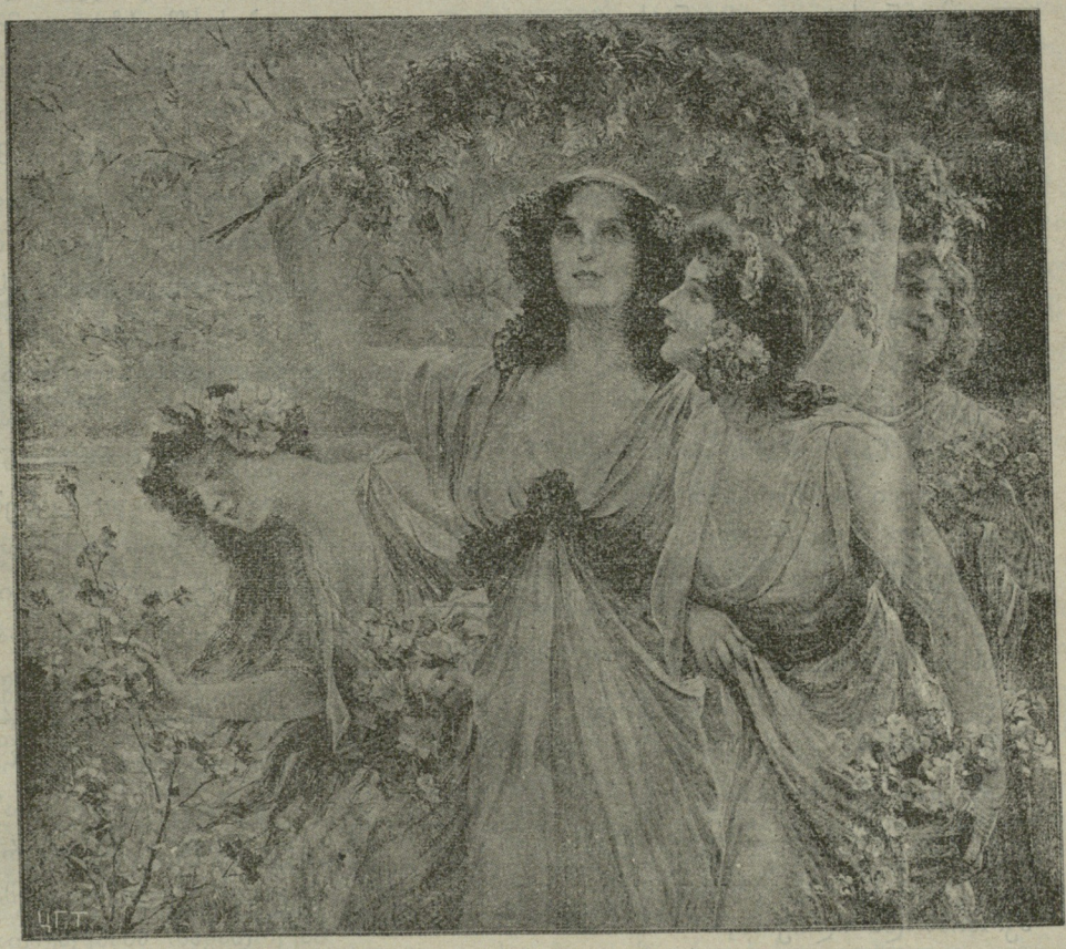
გ ა ზ ა ფ ხ უ ლ ი.

მოულოდნელი ტესნიკური დაბრკოლების გამო ეს ნომერი ნახევარი ზ უკან იკატურით გამოდის.