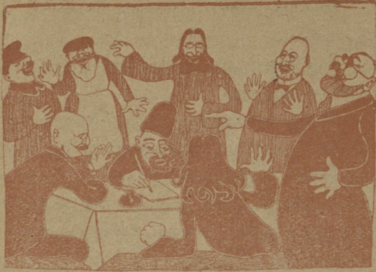
შე-რახმელები წერილს სწერენ სპარსეთის შ.პ.ს კონსტიტუციის შემოღებისათვის.