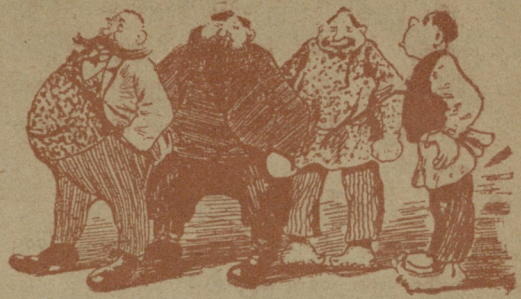
ქეშმარიტ რუსთა დიბუტატები.