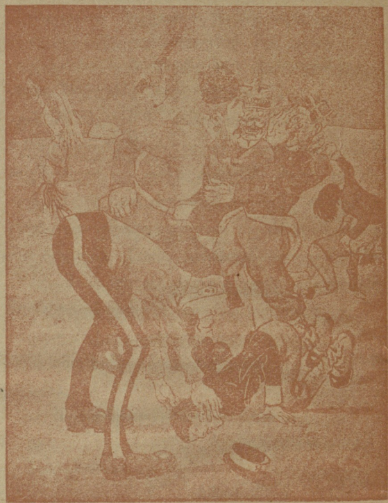
პაავის კონფერენციის შემდეგ.

დებულსა; ხოლო სხვათა ჟამთა შინა სიზმარი ესე გამოხატავს თფილისის რუსულ გაზეტებსა, თანაარსს აზრითა თვისითა.