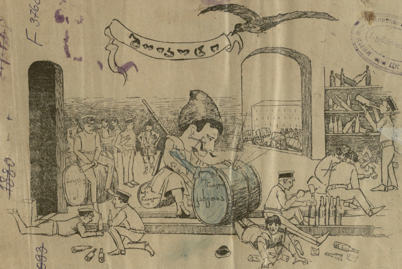
„კახეთის“ სარდაფში მომუშავენი.