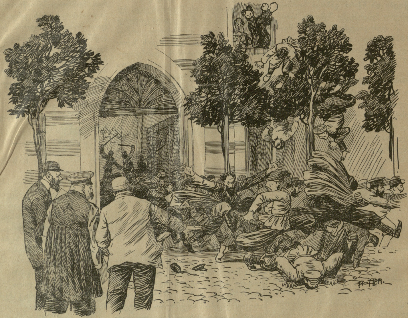
ნეტარ არიან დევნილნი სიმართლისათვის.

ხოლო თუ საზოგადოებამ ბოლოს ქედ მოიხარა მათ წინაშე და დააკმაყოფილა ეს უეჭველათ მათ გულკეთილობას უნდა მივაწეროთ და არა მუშების ბრძოლას. ირეთელი