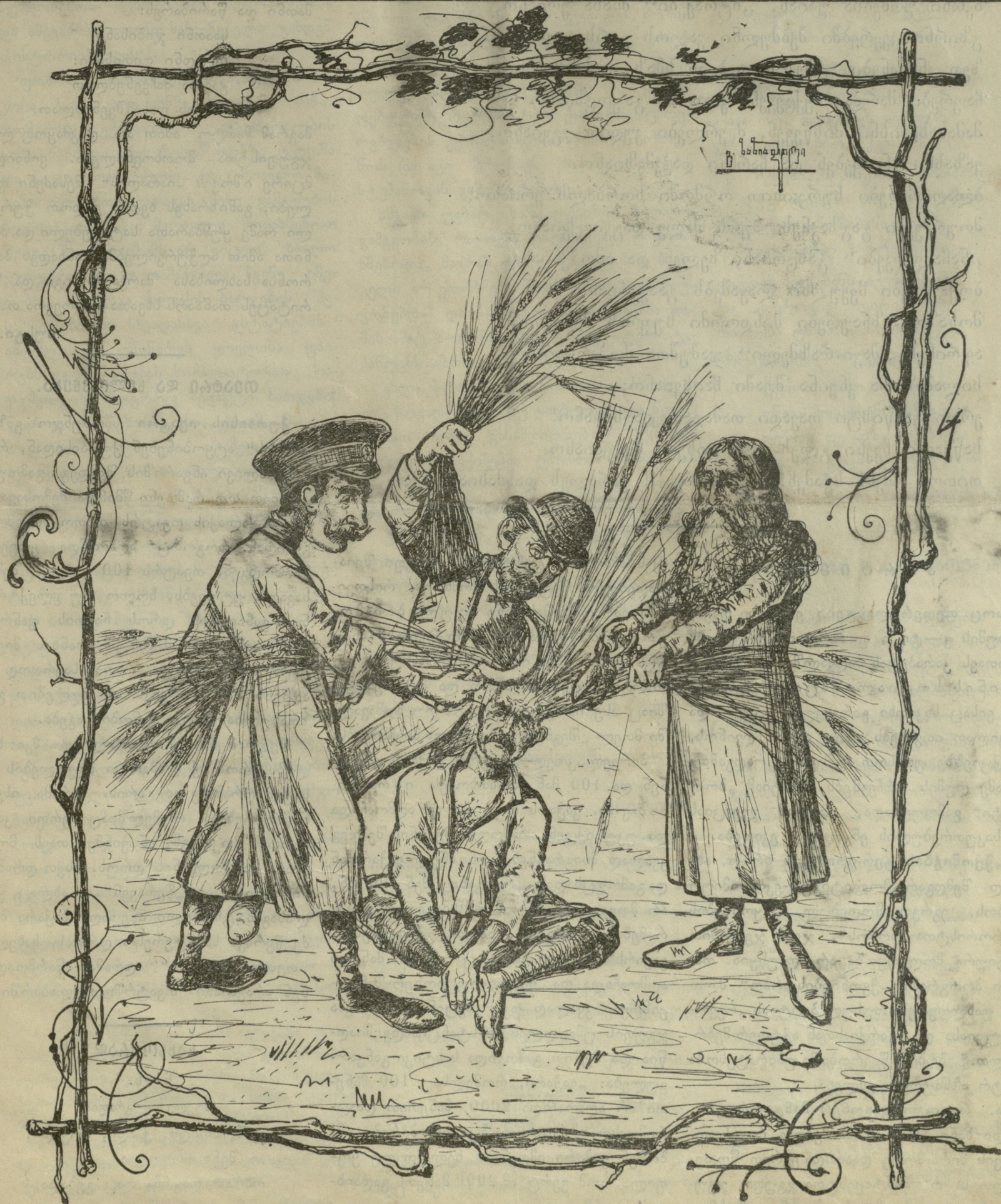
დასაძინებელი. მემამულე — ჰოპუნა, აეხე, აეხე! მღვდელი — ერთი ჩემი მკაცრად ვაჭარი — მე თუ თქვენ ჩამოგივარდეთ ქალიჩუნა დამიძახებ.