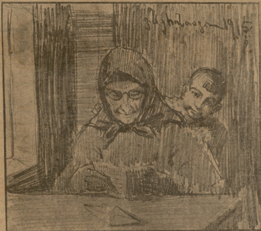
წერილი შვილი-შვილისა: ბებიავ ჩემო, შორიდან ხელის გამოწვდით მოგიკითხავ... ორჯელ დავიჭერ, მაგრამ ღვთის მადლით კარგად ვარ...