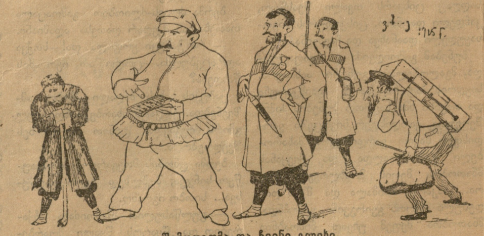
შემოდგომა და ჩვენი გლეხი.