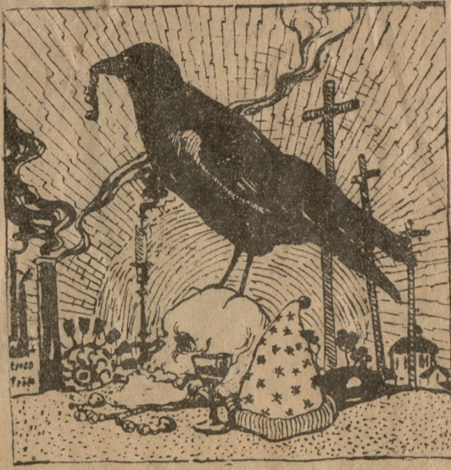
ახალი წელი. ნახატი კრ—ისა.