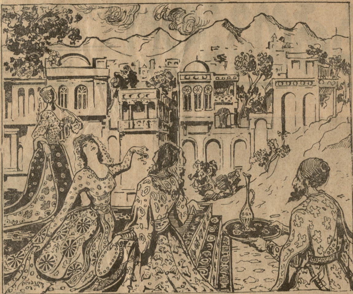
ცეკვა ძველს საქართველოში