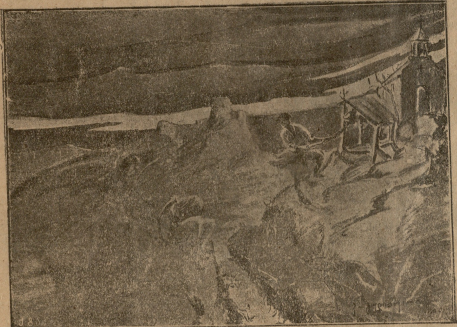
ქველი და ახალი წელიწადი.