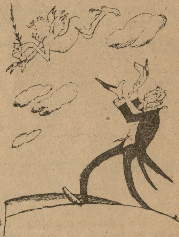
ბეტმან-ბოლღევი: მე ამ ზავს გავუშვებ და ვისაც ჰსურს, დაიჭიროს!