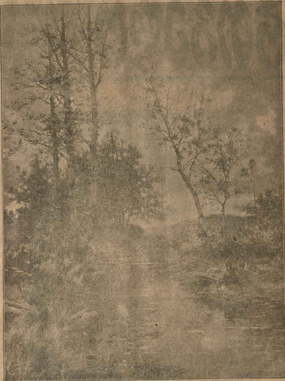
ოცნება წყლის პირად.