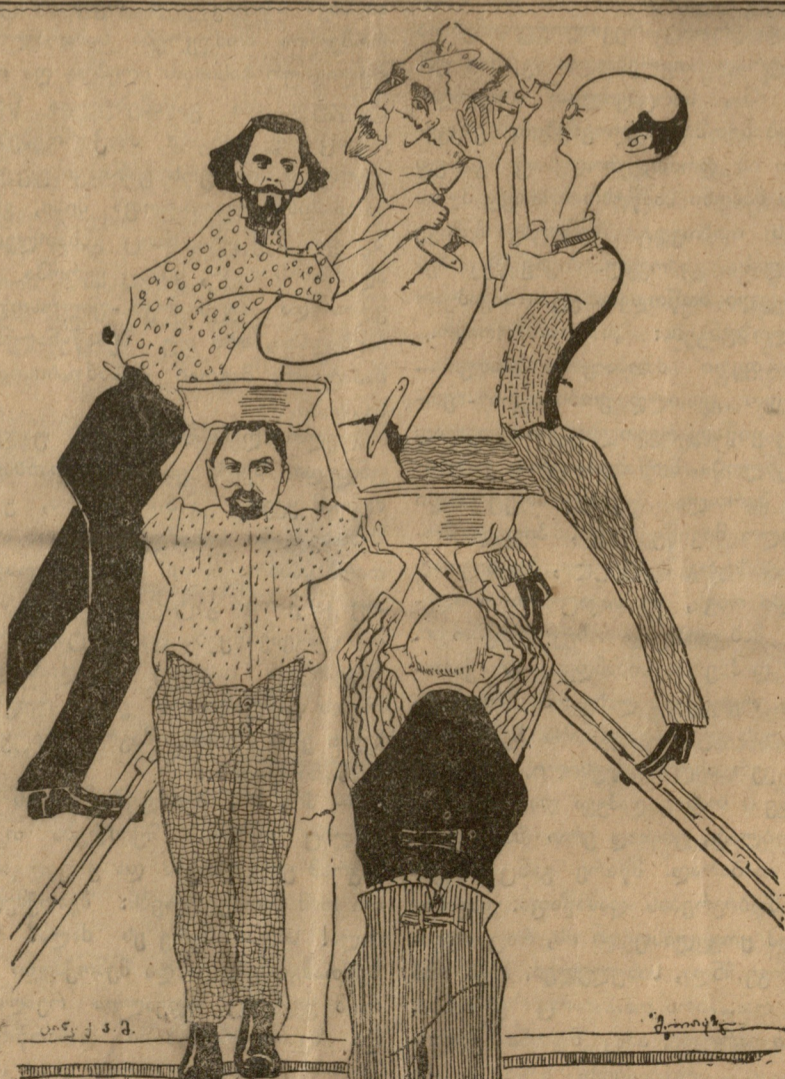
პრ. მარტი და მისი კალატოზები.