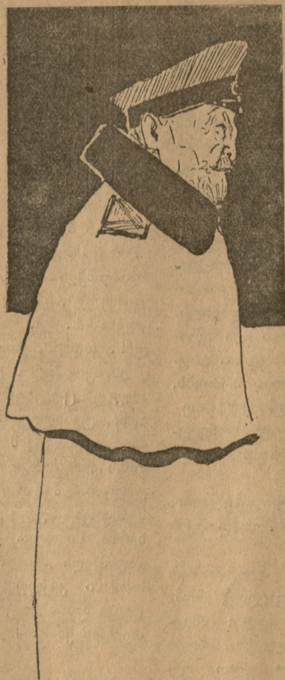
გ. ყაზბეგი წ-კ. გამ. საზოგადოების თავმჯდომარე. (ქ. შ. წ.-კ. ს.ხ. კრებების გამო).