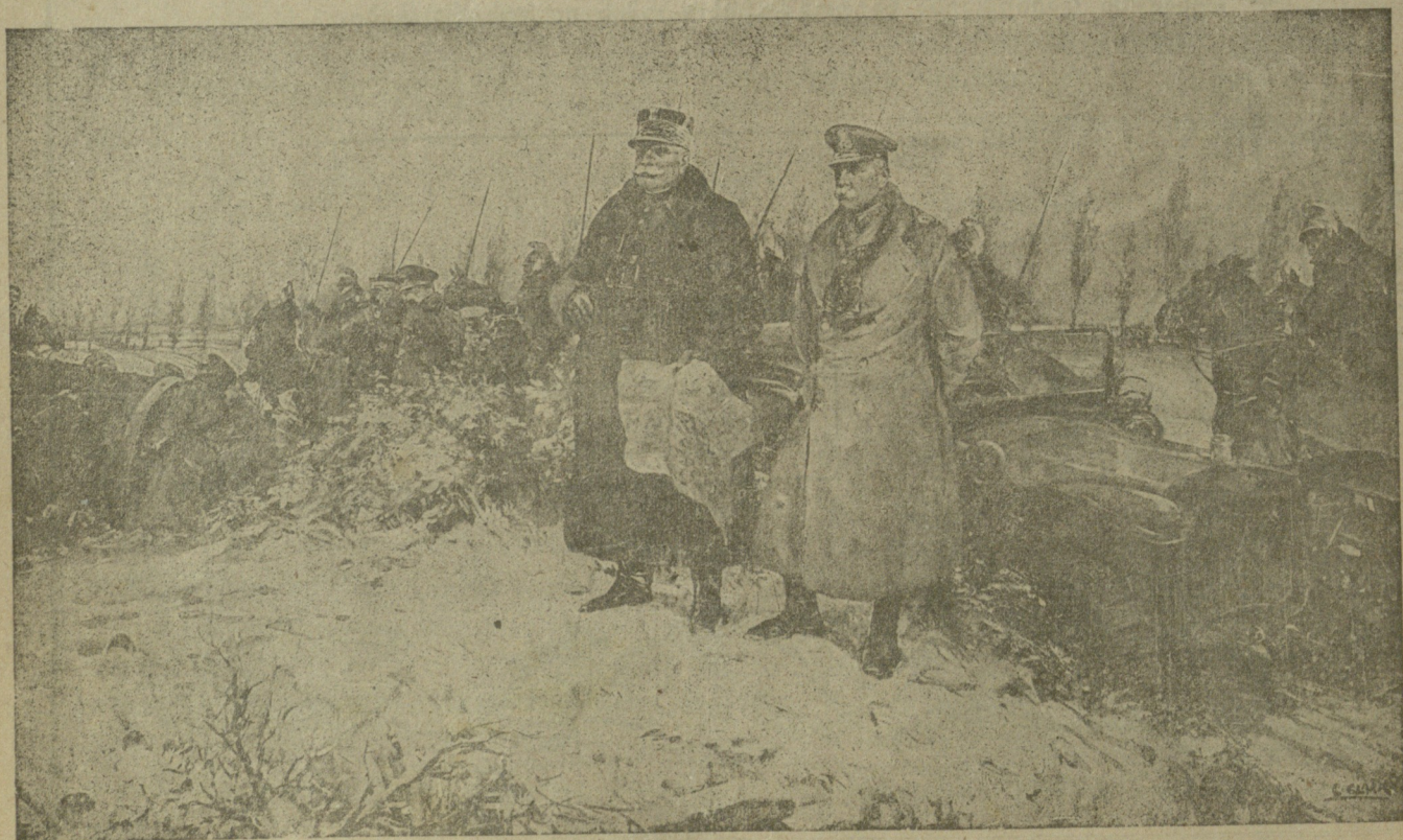
მოკავშირეთა ჯარის მთავარსარდალი გენერალი ჟაზეფ-ჟაკ-ცეზარ ჟოფრი და ინგლისელთა სარდალი ჯონ კიტჩენერი.

ნებანდართულია საშს. ცენზორ. სტამბა აშს. „შრომა“. რედაქტორ-გამომც. თ. ბოლქვაძე