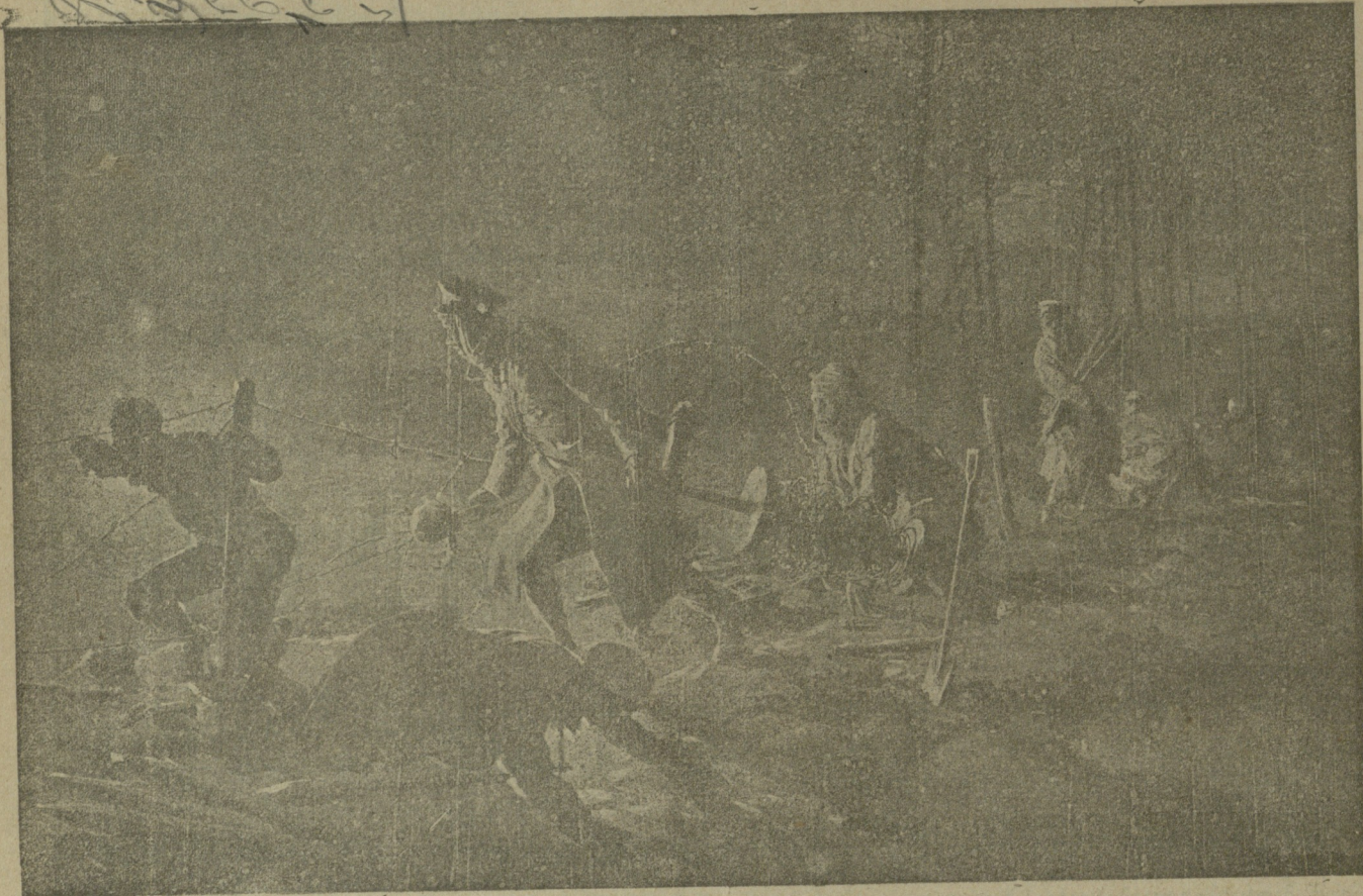
როგორ აგებენ მართულ ხლართს ღამით სანგრების გასწვრივ.