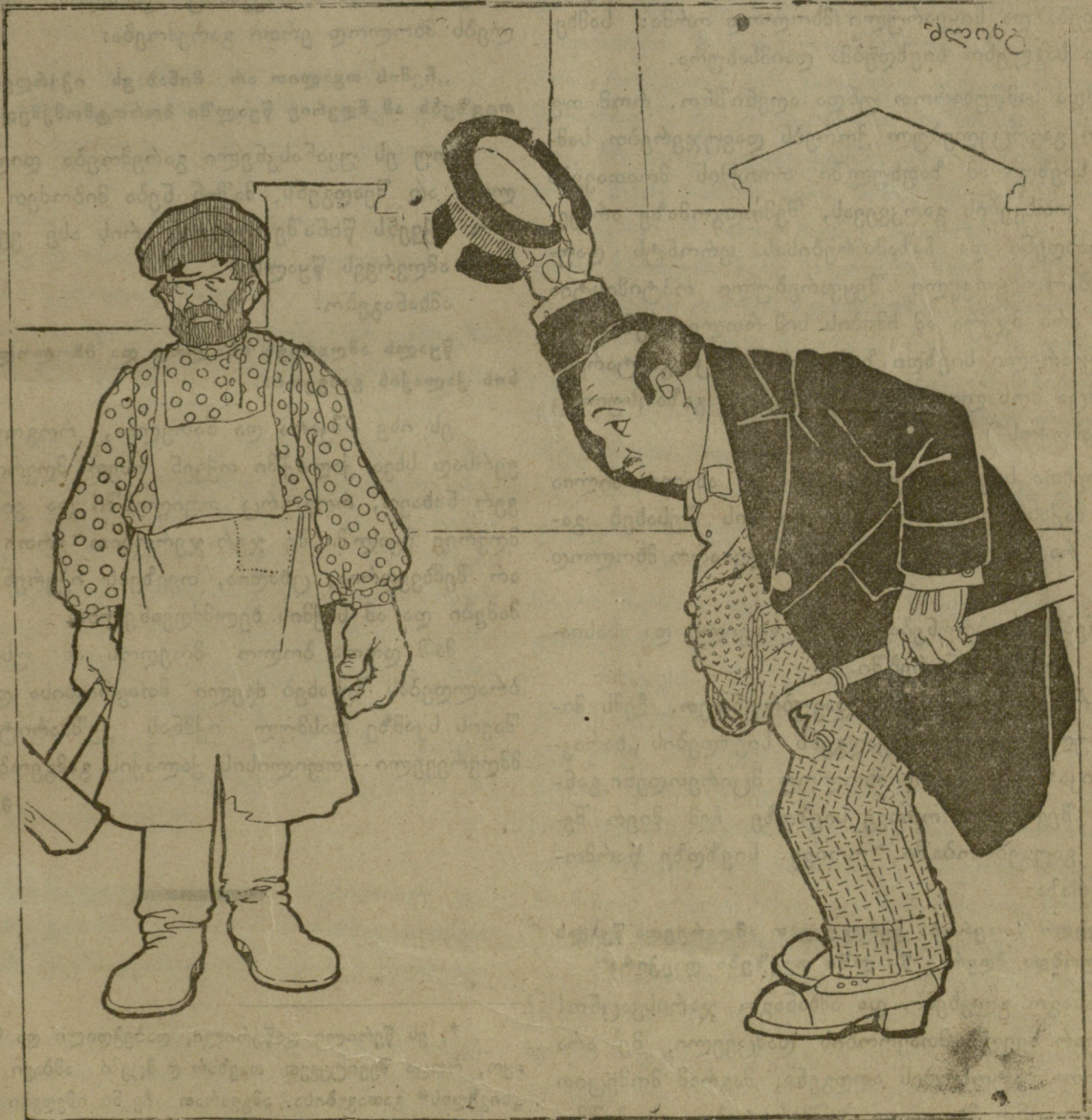
ახლა კი რას ეხედავთ?..