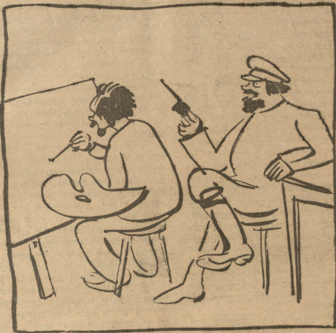
საბჭოთა რუსეთში, მხატვრობას ფართო ასპარეზი აქვს მიცემული: პლაკატის დამთავრებამდე მხატვრის სიციცხლე უზრუნველყოფილია.

მორება. რაღა ვქნა ახლა... ნენა, ნენა, ნენა. (მიიჭახის გზაში ხმა მალლა გიტო და ექიმის მოსაყვანად მირბის).