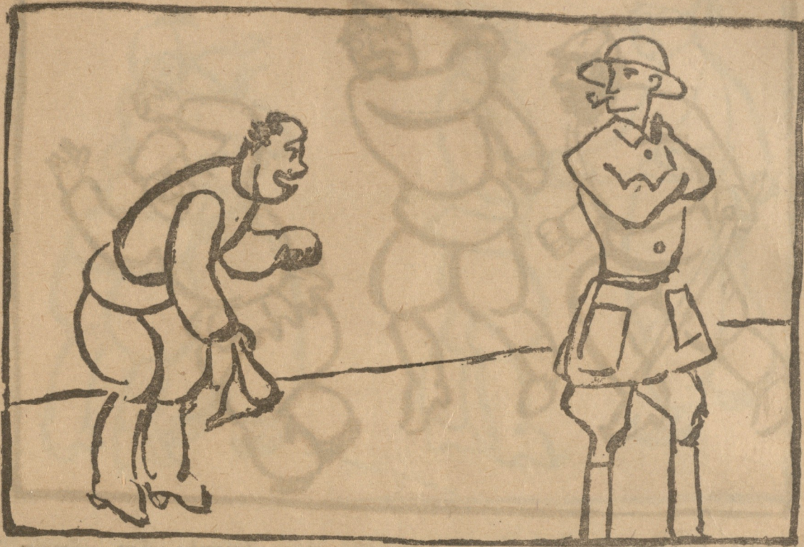
კომუნისტი (ინგლისელს რომელიც მას უყურებს) გეხუმრებოდი ღმერთმანი..... აბა რა გაჯავრებს, ხუმრობა არ იცი....

არის და თუ ყუთში არ იქნება, მაშ ღმერთიც აღარ ყოფილა.