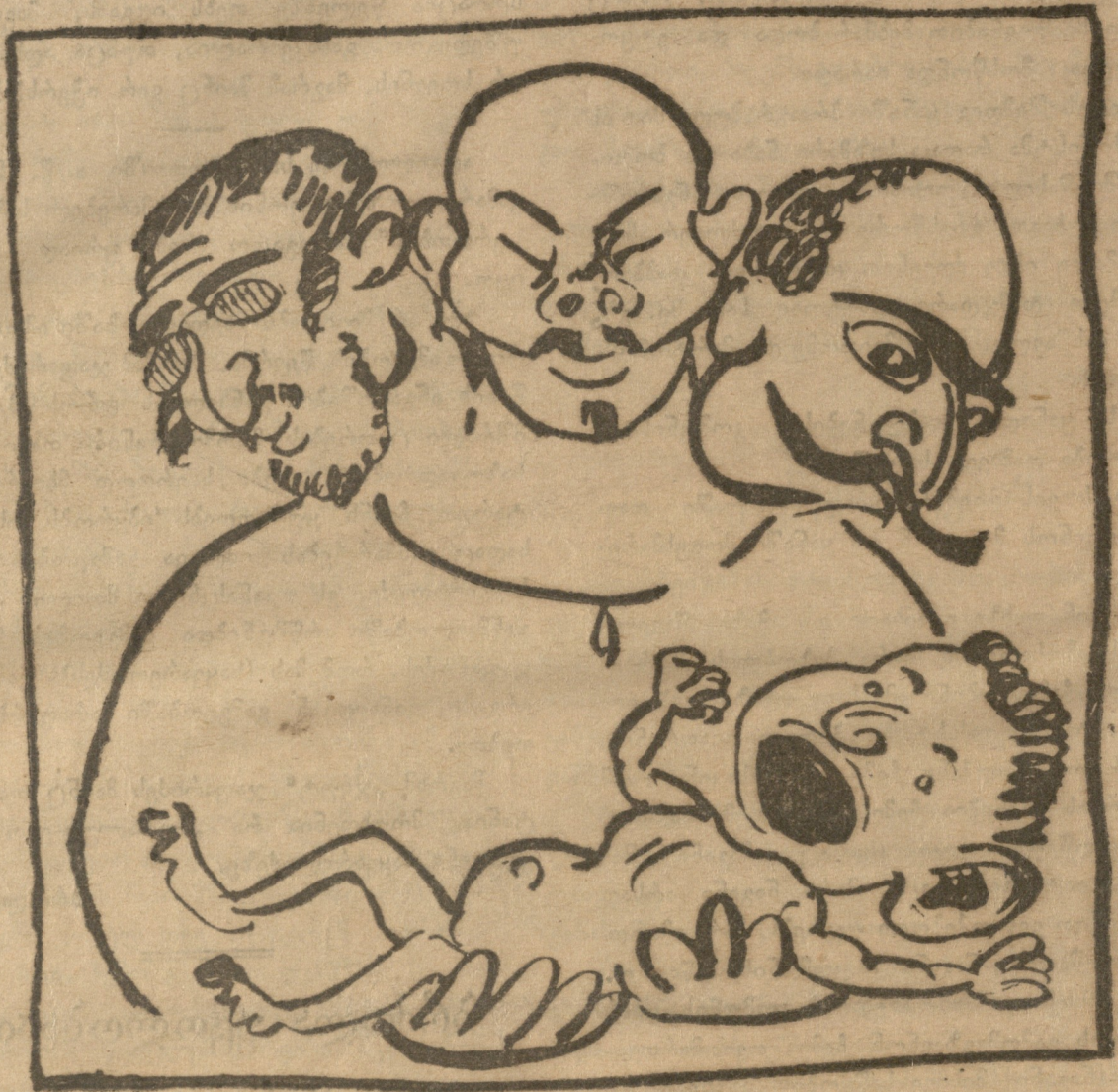
სამ-პიროგანი მამის პირმშო რუსული კომუნისში.