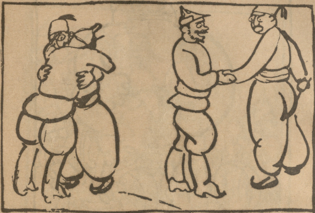
კომუნისტი (ოსმალოს) მოდი, მოდი გადამეხვიე ყარდაშ, ჩვენ ერთად უნდა ვიხსნათ აღმოსავლეთი და დასავლეთი ბარბაროსებისაგან!