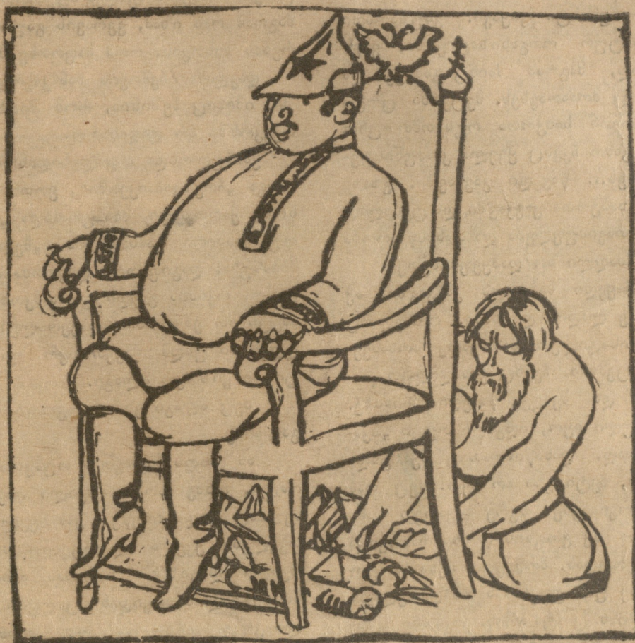
შაგრამ რუსის გლეხმა სხვანაირათ განსაჯა და ცდილობს ცეცხლი კომუნისტის სავარძელ ქვეშ გადმოიტანოს.