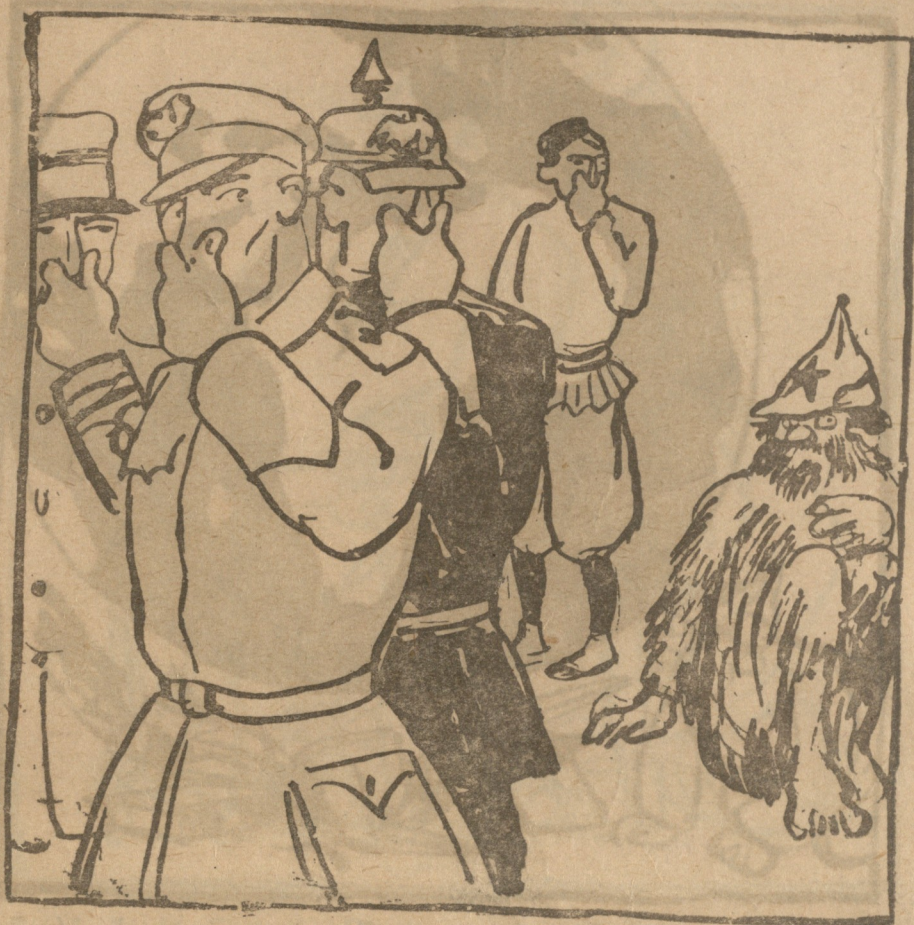
მაგრამ მას, ე. ი. კომუნისტს, უფრო ადვილად და შეუცდომლად სუნით სცნობენ ხოლმე.

მაგრამ საქმე, ძმავ, ის არი, ცოლები რომ აცილებენ (შიშს და ფიქრებს იცილებენ) მამებს შვილნი მისტრიან — გულწრფელ ცრემლსა დაადვრიან.. ცოლები?... რა მოგახსენოთ?! ვფიქრობ გაზეთი გამოვსცე „მოამბე“ იქნეს კოჯორის, საშვალეზა ყველას მივსცე — ცნობა ამბის მხარის შორის, (სულ სიმათლის, და არ კორის) მაგრამ... რა ვსთქვი: აქ კოჯორში ყველაფერი ასად ძვირობს, — ტფილისელი გაზეთები ორ თუხნად ღირს — არვინ კვირობს, აბა თქვენ სთქვით, რომ გავყადო მე „მოამბე“ მაქ კოჯრელი, ფასი უნდა გავადიდო ამბებით ვქნა ის მე ქრელი — თქვენვე ბრძანეთ — იმდენს მომცემთ რაც „მოამბე“ დამოჯდება. არა, ქვეაში არ მიჯდება. რომ ზარალი მე აქ ვნახო