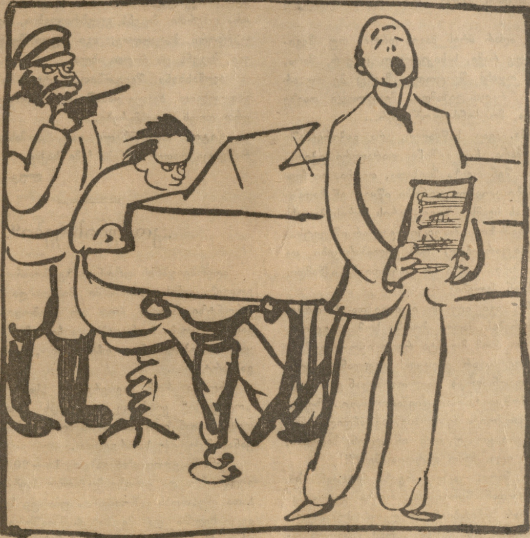
კომუნისტურ რუსეთში ხელოვნება სრულიად თავისუფალია ყოველგვარ ძალდატანებისაგან, რაიც აშკარად სჩანს ამ სურათზე.

აღმასხანა. მართლა საცოდავი ყოფილხარ ბიჭო გიტოია, რაღა დროზე უგზოლია ოჯახი?! გიტო. აბა რას ვჩივი, აბა რას ვტარი მე წყაღწელებოლი... წახანე ვჩიოდი, იმის არ იყოს... ისე მქონდა სათოხავი მოძალებული, ისე ისე, რომე, ერთი კაცი ახლა ყანაში ათასი მანეთი ღირს, ვიფქრე, იღე და ღამე არ ვიძნებ ამ ერთ კვირაში სიმინდის თოხვას ჩავათავებ, სახლში პაწას ქალსაც შუღწყობ ხელს მეთქან... იმას კი დეეწყო ხელები გულზე... ყანაში წვევდი აქილას და პატკულიას უთხარი: ბეჩა, სადილი პაწა ადრე ვაკეთ, დღეს და გამოატანე ციცავს, პალასიას მეთქი... წავედი, მივედი, თავი არ ამიწვევია ტყუილათაი ერთჯერ ზევით, ისე უბაკუნებდი მრწას თოხს... უყურებ, უყურებ, უყორყუტებ, არ სჩანს სადილი. ბიჭო, რა ღმერთი გუუწყდი აწი, ვფიქრობ გუნე-