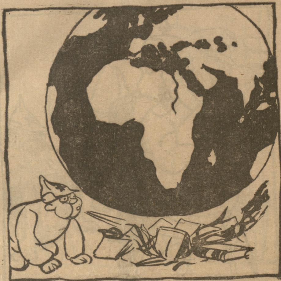
კომუნისტმა განიზრახა მთელი ქვეყნიერობის ცეცხლში გახვევა და თავისი ბროშურები შეუნთო.

ვცდილობ არაფერი დავაკლო ჩემს თავს და საუკეთესოთ ვიცხოვრო.