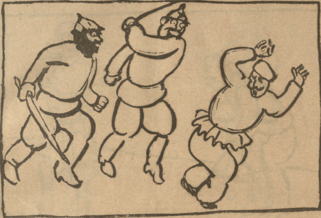
კომუნისტ (ადირბეიჯანს) შე თათარო მამა.... მე, ვიცი, როგორი უნდა ასწავლო თათარს ჭკუა. აი როგორ, აი როგორ!

გორი ტანისამოსი უნდოდა ისეთი ეტარებია და წვერიც ისე შეეხვინტილებია, რა ფასონიც მის სახეს მიუდგებოდა.