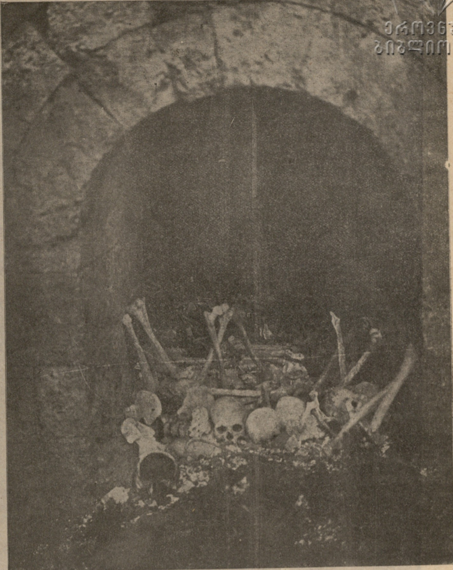
საქართველოს ისტორია. მამულის დამცველნი. ჩონჩხთა მთა. ბიეთის სავანე-მონასტერი.

მოხუცმა ყრმას გადასცა ოქროს ყუთით სამშობლოს საიდუმლო. რაღაც სიტყვა ჩასჩურჩულა და წარსულმა ჟამთა ვითარების აჩრდილმა დახუჭა თვალები.