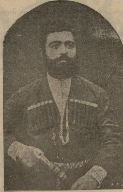
სვ. გ. ბეკნიშვილი. (+ 6 ქრისტეშობ.)

დარეჯან. ისე გამოვიცნო?.. მაშ კარგი! ოცდა ათი იქნება!.. ლუარსაბ. ოლოლო შენ! ვერ გამოიცანი! დარეჯან. მაშ რამდენია? ლუარსაბ. რაღენია?—გითხრა?.. არა, არ გეტყვი. დარეჯან. სთქვი, თუ იცი, რაღა! ლუარსაბ. თუ კაცი ვარ, ორმოცი უნდა იყოს!.. ოლოლო შენ... მე გამოვიცანი! დარეჯან. დიახ, გამოვიცანი!.. დაგითვლია, როგორც იმ დღეს ჰქენი... ლუარსაბ. ხომ მეც გამოვიცნობდი! ლუარსაბ. შენც არ მომიკვდევ და ის კარგი მამა არ წამიწყდეს, რომ არ დამითვლია!.. დარეჯან. მაშ საიდან იცი, რომ ორმოცი? ლუარსაბ. საიდან? იქიდან რომ გონება მაქვს... დარეჯან. განა მე კი არა მაქვს გონება? ლუარსაბ. შენც მაქვს, მაგრამ კაცის გონებასთან დედაკაცის გონება როგორ მოვა!? მე ვარაუდით მიგხვდები რომ ორმოცი!.. დარეჯან. რომ არ იყოს ორმოცი? ლუარსაბ. ჯარიმა გადამიხდევინე!