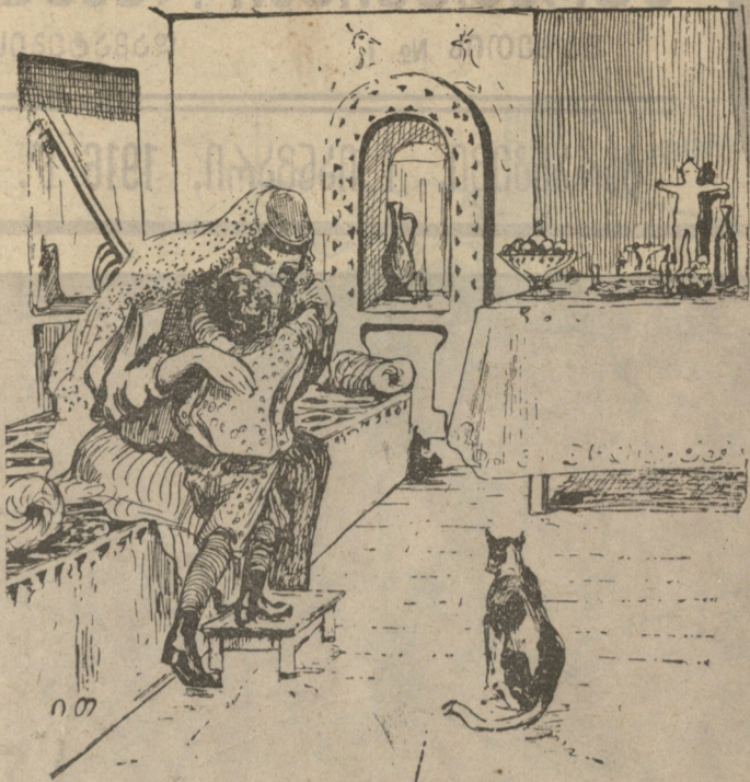
დედილო! მოგილოცავ ახალ წელს! ნახატი ირაკლი თოიძის (მ. თოიძის შვილი)