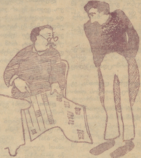
ბ. რედაქტორო! ამ ქალაქის სიძვირეში ეს ვაზეთი შეგვიძლიან ხელმეორედ დავბეჭდოთ.