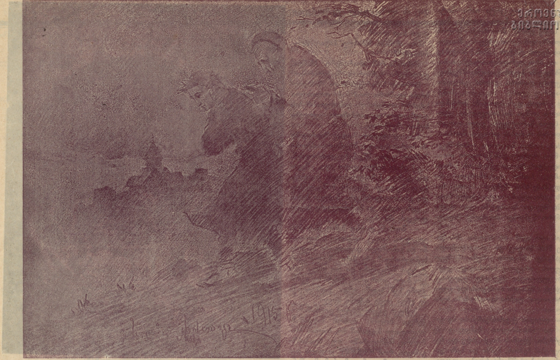
მე ჩემი განვლე, შვილო, ეხლა შენ იცი