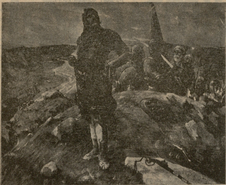
8. საბაბში. (ნახატი ვ. ს. — ერისთავისა).