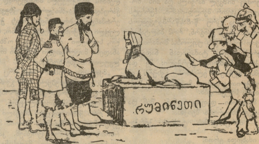
შეთანხმებულნი: | სფინქსი თუ აღდგა, ჩვენ მოგვემხრობა! მოკავშირენი: | უთუოდ მათი დიდი აქვს მტრობა!