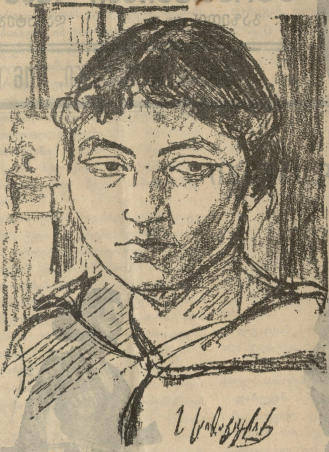
სახე ქართველ ძალიან.