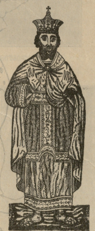
მეფე მირიანი რომლის მეფობის დროსაც მიღებულ იქნა ქრისტიანობა.

(დასასრული) III. როცა დანიელმა კარი შეაღო, ყველას ერთგვარმა შიშის კრუნატვლა დაღრბინა. მოხუცი წინასწარმეტყველი, ქაბუქის გამომეტყველებით კარგბშივე გაჩერდა და რისხვის ისრებით თვალს არ აშორებდა ბალტასარს და ვლრსარს. — დანიელ, — შესძახა ელისარმა, — ახლოს მოდი, მეფეც მოსსურვა შენი ხილვა. — უკვე მომხსენდა, — იყო წყნარი პასუხი წინასწარმეტყველის მხრით. რამდენიმე ნაბიჯი გადასდგა და გაჩერდა. ბალტასარმა გული მოიკა. — მამამან ჩემმან, დანიელ, შენც სხვებთან ერთად წარმოგატყვევა. ვიცი, რომ ის საშინელი სიზმარი, მამას პირველმა შენ აუხსენი. გულთამხილობა და საიდუმლოს ამოცნობა შენებრ არ უწყის არც ერთმა ქურუმმა და ბრძენმა, ვინც კი ქურუმად და ბრძენად ვიწამეთ მთელს სამეფოში. მამ გაგვაგებინე, დანიელ, რას ნიშნავს ეს წარწერა, რომელიც უცნაურმა ხელმა მოჰხაზა კედელზე. სიტყვი, ავგისხენი საიდუმლო და მე შეგმოსავ პორფირით, ოქროს მანიაკით მოვითავ ყელს და ჩემი სამეფოს მესამე მთავრობას გიწყალობებ. — მეფეც, პორფირი ნუ გინდა ჩემთვის. სისაწყულე შენი დიდფარე. ჯილდოდ წინასწარმეტყველთ დევნა და წამებაც გვეკმარვის. — ხომ წაიკითხავ ო წარწერილს? — დიხ, მეფეც, იგი უკვე წაიკითხე მაშინ, როდესაც მუტობინი ჩანგთა სიმით გვაგბრუებდნენ, როდესაც