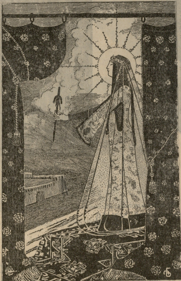
წმ. ნინო. ნახატი ი. ნიკოლაძისა.