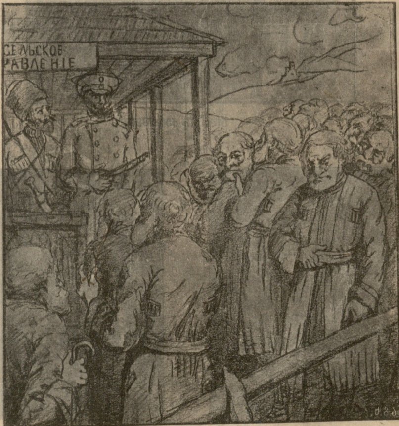
„სოფლის შრომაზე“ ნახატი ა. გ. ციმაკურიძისა.