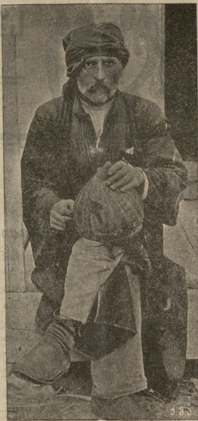
ვაშვაშვაშვილა, გარდაცვალებიდან ექვსი თვის შესრულების გამო.