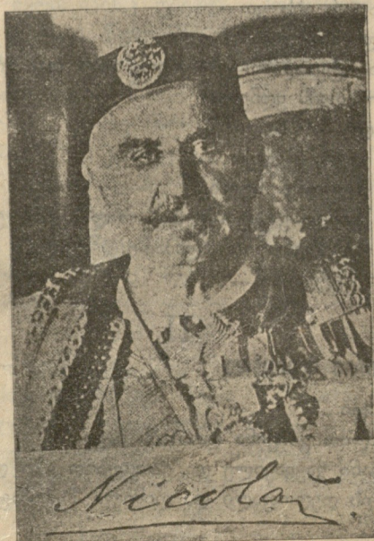
მთაშავეთის მეფე ნიკოლოზი. ღტოლფილი თავის სამშობლოდან