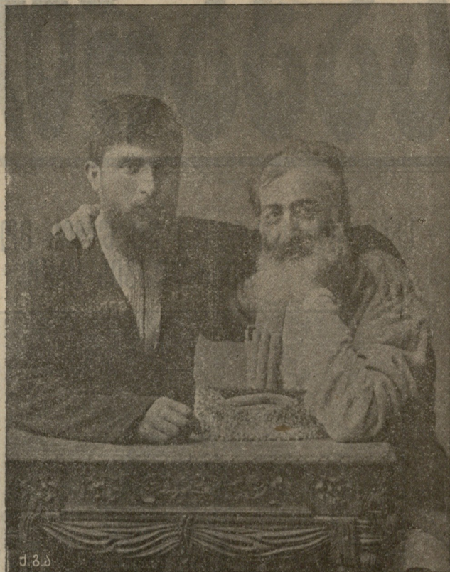
ვაშა და ვაშვაშვილი.

იყო წმიდა როგორც თოვლი ქალწულ ცრემლად დაფრქვეული, მიწიერმა ვით ვთქვა ქება, ისე წმიდა იყო სული..