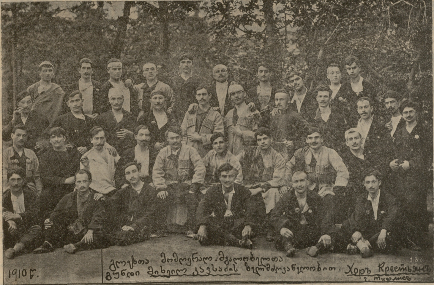
კვირა, 31 იანვრის კონცერტის გამო.