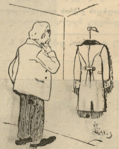
მილოვი. მახლას! „ვაი რა კარგი საჩინო, რა ავად მიმიჩინესო! „დამადეს ფეხზე ბორკილი ციხეში გამაჩინესო!

—საქმე არ ჰქონდეს ხუროსა დაჯდეს და არახუნოსა!