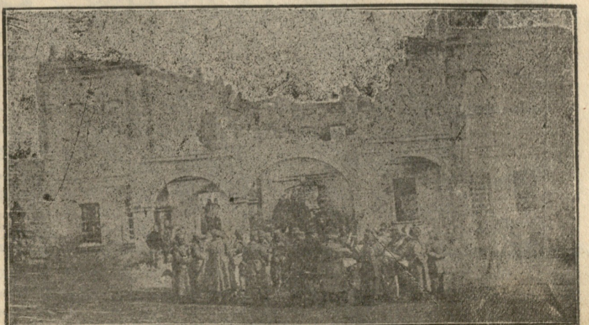
ჰასანკალე. გუბერნატორის დანგრეულ ბინის წინ.