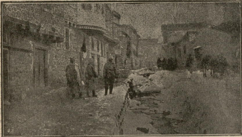
აზრუმის ერთერთი ქუჩა.