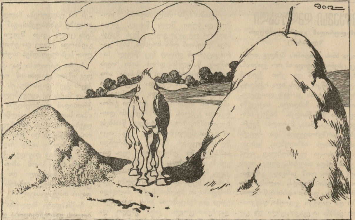
ძველთაგანვე განთქმულია ბურიდანის ვირი, თივა-ქერის არჩევანში გაჰხმობია ცხვირი, ვერც იქ მისწვდა, ვერც აქ მოსწვდა, დარჩა ანაყვირი! (ძველი არაკი.)