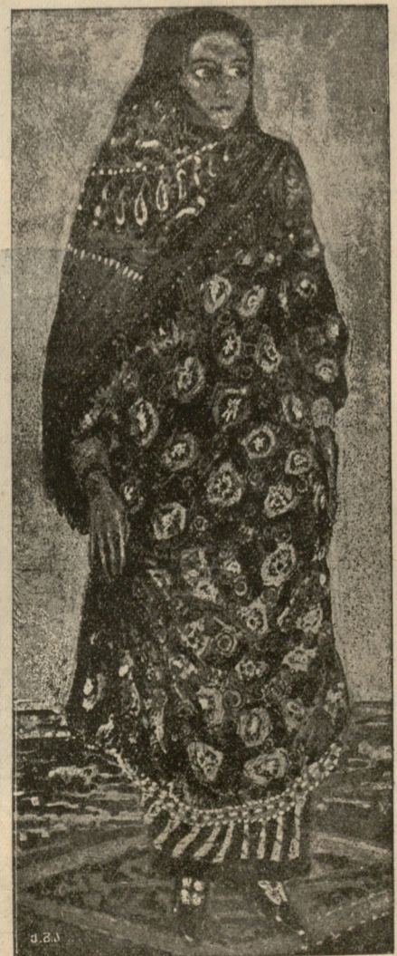
ღეის ქალი (გუნბიდან) ნახატი ხალილ ბეგ მუსხავეისა.