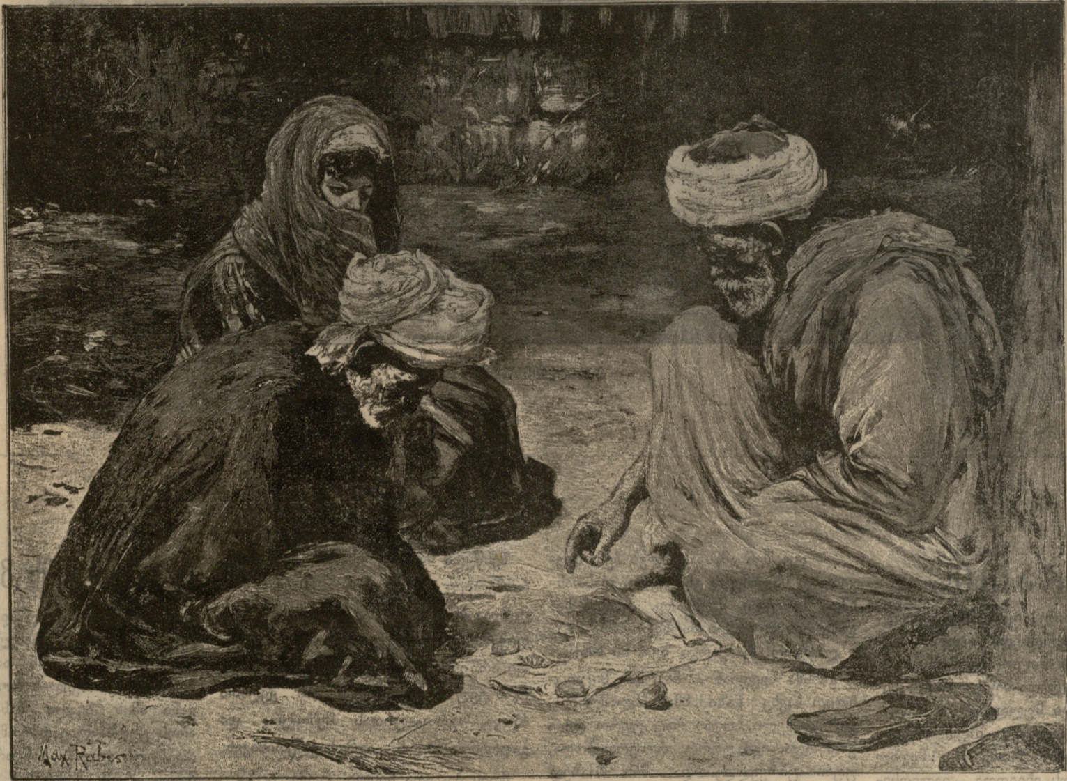
მისწავთან: შოთყა ოჯახის ბურჯი თუ არა?!

გამოფიზილდა ერი ჩემი, შეიშმუნა, გაიღვიძა; დავაქაცდა, დაჭაბუკდა, მოიშორა ლალა-ძიდა! ჩამოდექით, გზა მიეცით, ნუ აბრკოლებთ სულით ძლიერს! ველარაგინ ვერ შეუცვლის დღეის იქით ფერს და იერს! ია ქართველი შვილი.