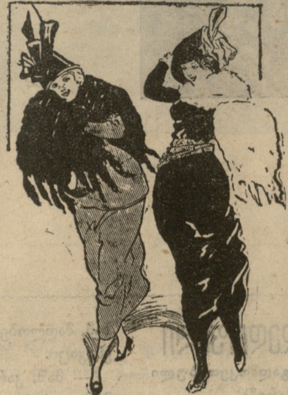
— თითქოს ის ოფიცერი გეჯავრებოდა და ამბობდი, ცოლად არ წავყვებიო! — მინდა მალე დაგქვივდე და „პენსია“ მივიღო, ჩემო ძვირფასო!