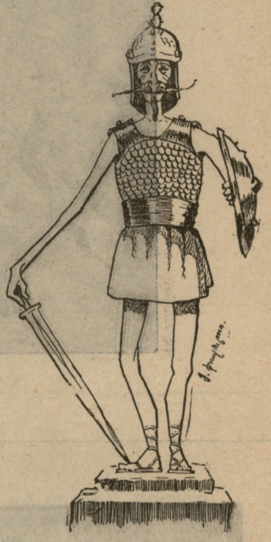
ი. გევალი. თვისის ფარ-ხმლით.