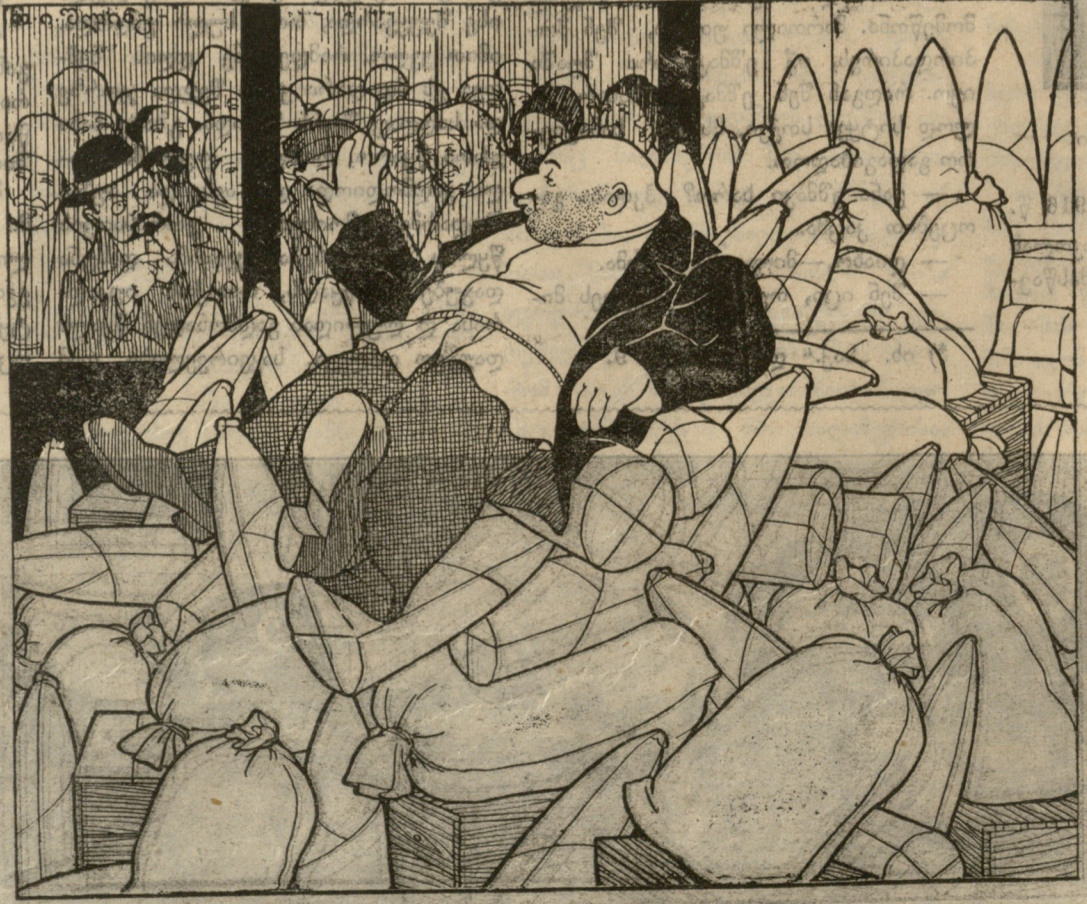
— ტყუილად მოსულხართ, ტყუილად! თბილისში შაქარი და ფქვილი სრულდებით არ იშოვება! (თავისთვის) ჯერ ფასმა ავწიოთ, მერე მე ვიცი!