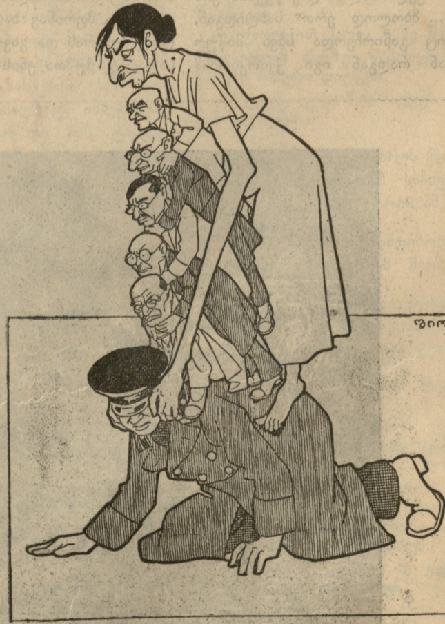
მოწაფე (მღერის) მივალ, მივალ მივდივარ, ბობლით მივეჩქარები! ტვირთს გაუძლებ თუ არა, ლაყს კვერცხს დავედარები!

საწყობს ვეძებდი შაქრისას, ვერ ვპოვე, დაკარგულიყო! ქალაქის საბჭოს მივმართე, თავებად ამოსულიყო ფული მომთხოვეს, მივართვი, მითხრეს: წაიღე, სულიყო!