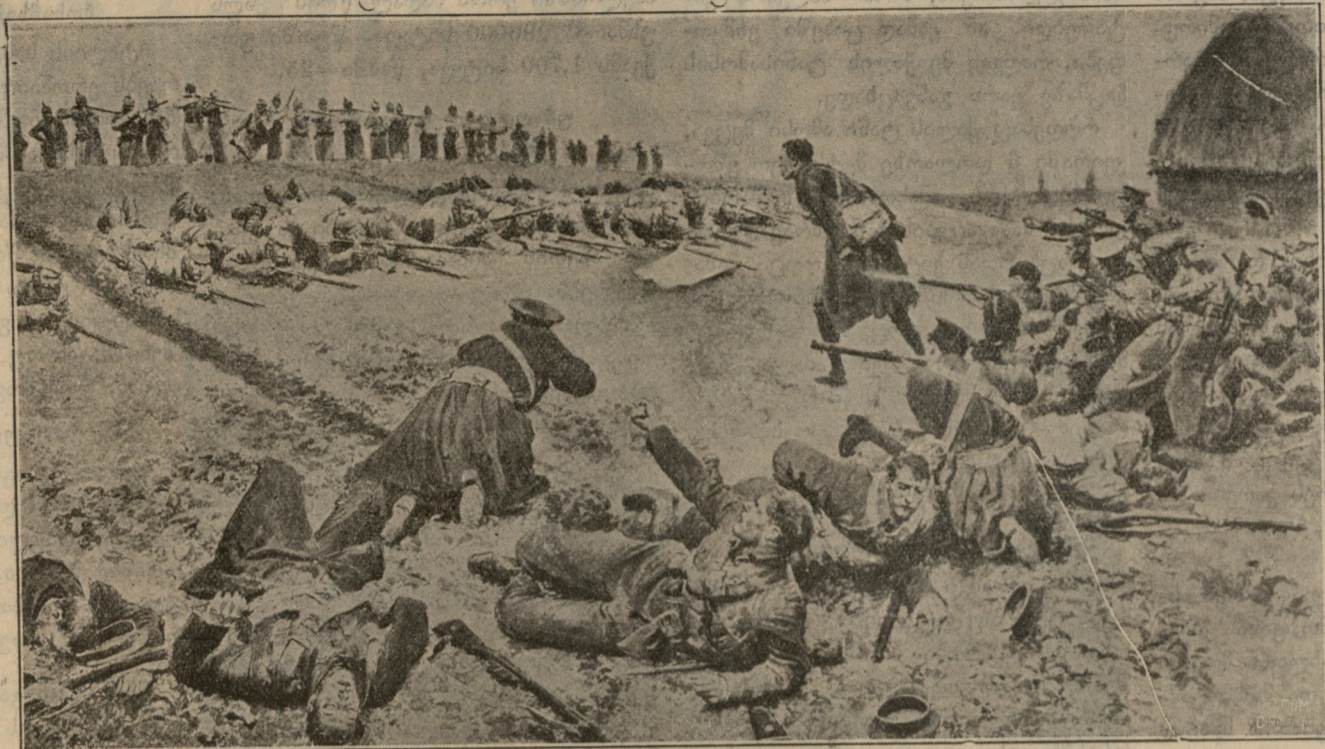
ი ე რ ი შ ი.