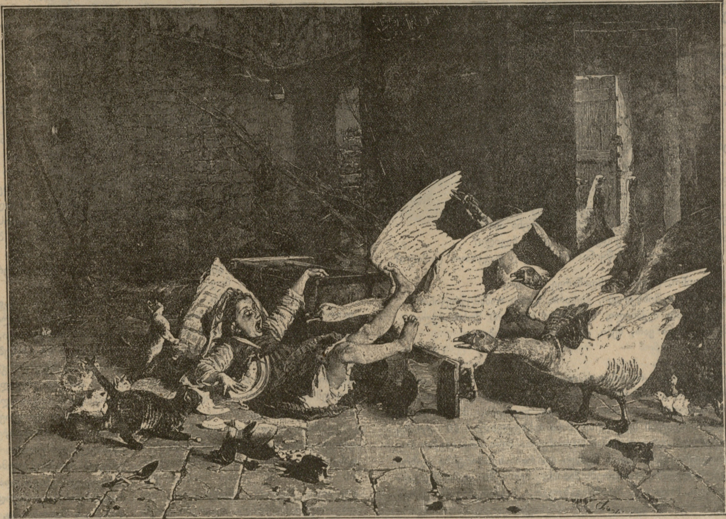
ბ რ ძ ლ ა.