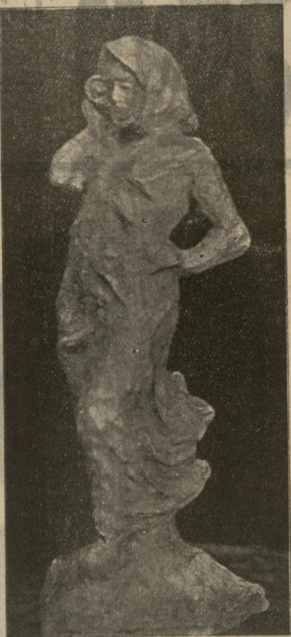
ქართველი ქალი ქანდაკეა მ. კიაურელისა.