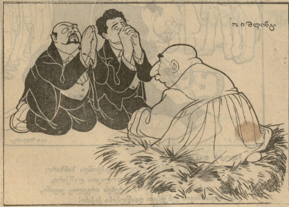
ო. ი. შ. ღინგე