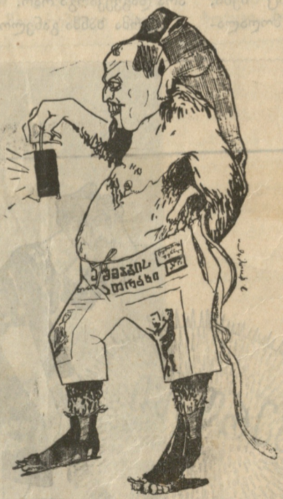
დაეძებენ მასალას ეშმაკი და თაგუნა.

ლადო მესხიშვილი. კარგადა ვარ სხვაგან მივრბი, ავადა ვარ აქ მოვალო, ახლაც ფონი არსადა სჩანს, უძნოთ მრჩება მშრალი ჯკალო, მოდი ისევ შინ დავბრუნდე, თვალი მშობელს მიმოვაგლო, რუსის დასი ქუთაისში არ იქნება სავალალო,