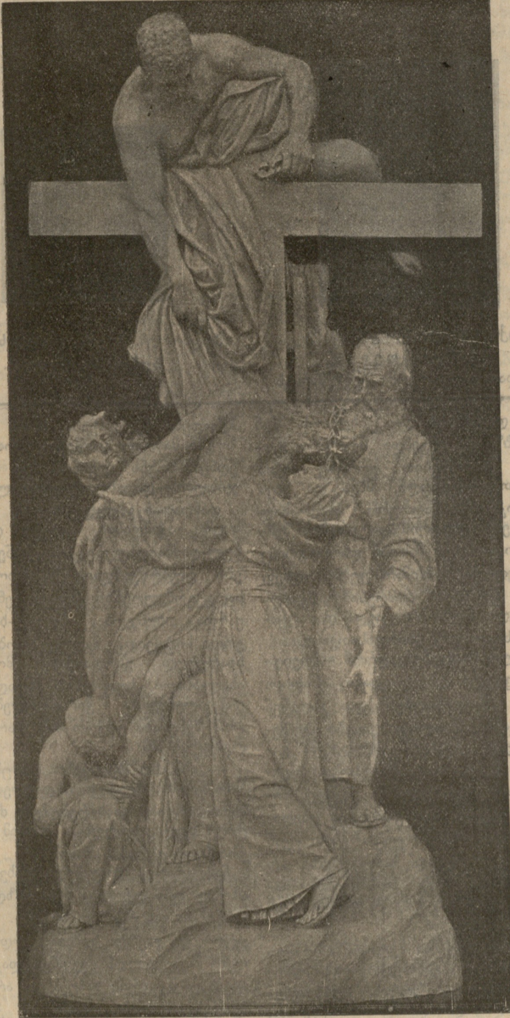
გ ა რ დ ა მ ო . ხ ხ ნ ა

— ახ ჩახმახიანო თოფო, გაგიწყრეს ნამკურთხი, წამოიძახა სასოწარკვეთი- ლებით მეცხვარემ და რამდენიმე ალა-