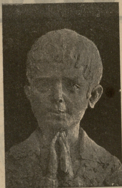
ბავშვი — ქანდაკეა მ. კიაურელისა.