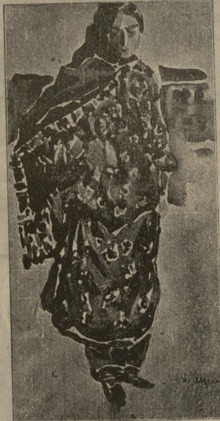
ნაიბის ქალი — ნახატი ხალილ ბეგ მუსაევისა.

ბოლოს მატარებელი გაჩერდა პატარა ბაქანზე. მაზე ჩვეულებრივი მოძრაობა არ იყო. ორიოდ გლეხიმგზავრი შეახტა მატარებელს და ისიც დაიძრა. დახვედრილმა ბიჭმა აიღო ჩემი პატარა ბარგი და შევუდექით სოფლის აღმართს. თვალწარმტაცი იყო ახლად გაღვიძებული ბუნება! აყვავებული, ამწვანებული! ვაი მისი ბრალი, ვინც ხან და ხან მაინც ამას არ ნახავს! ზოგს იქნებ სასაცილოდაც არ ეყოს რომ უთხრა, თუ როგორ დამწყდება ხოლმე გული, აყვავებულ ბაღს რომ ვეღარ მიუსწრობ. და უფრო მეტადაც გაეცინება, როდესაც ვეტყვი, რომ საქმის გამო სოფელში წასვლის დრო იასამნების გაშლის დროსათვის ხშირად შემირჩევია! მე მხოლოდ მაშინ მენანება ადამიანი სიკვდილისთვის, როდესაც სოფლად მაისს ვუმზერ! ჩვენი დედა-ქალაქი იმდენად მიმაჩნია ჩვენი ეროვნების სხეულის უმთავრეს ძარღვად, რომლისგან უნდა ვადმოსჩქეფდეს ჩვენი ინტელიგენციის გონებრივი ძალა, რამდენადაც ეს ძალა შუქ-შემტანი სხივისავით მოედება სოფლის მცხოვრებს. და ის კიდევ, სამაგიეროდ, თვისი შრომის ნაყოფით, აი ამ დიდ თაიგულებად ქცეული ხეების დაბარწული ვაშლებით, აი ამ ატირებული ვაშების დამკვრახული ყურძენით რომ ქალაქის გულს დაამშვენებს!