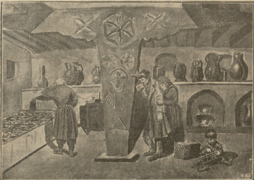
ჯარში გაწვევა — ნახატი მ. ჭიაურელისა.

გული ჩემი ზღვაა სიყვარულისა და შიგ მარადისობის ცეცხლი ღვივის შენს სადიდებლად!