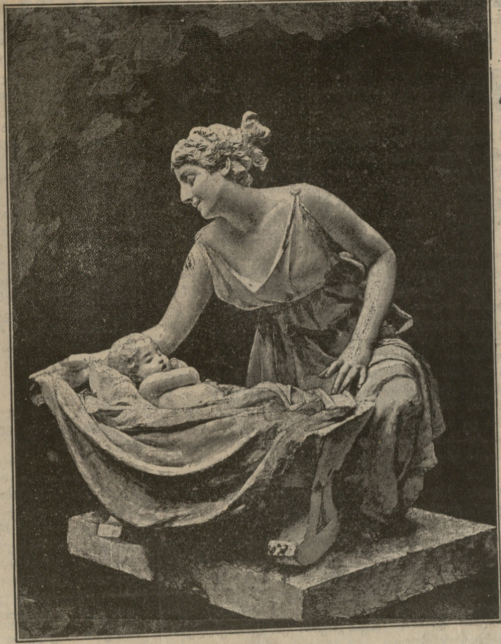
ღ ე ღ ა

როგორც ამტკიცებდა იგი, თითო მენდალი დასჯდომოდა მას არა ნაკლებ ხუთი მტრის მოკვლისა თვისი ხმლითა და საკუთარის ხელით ოსმალებთან ომის დროს; წმ. გიორგის ჯვარი მიეღო მისთვის, რომ იგი გადაცემული გარეულიყო ოსმალთა ჯაოში და დაეხვერა მტრის მომზადება და მოქმედება; „პრაპუნჩიკობა“ — მისთვის, რომ მტრის სამ სოფელს მიპარვით ცეცხლი წაუკიდა და გადაბუგა; სისხლის ჯვარი მისთვის, რომ იგი წინ უძღვოდა რუსის ჯარს აჭარა-ქობულეთში და გზას უჩვენებდა, როგორც ნავალი წინად ამ მხარეში.