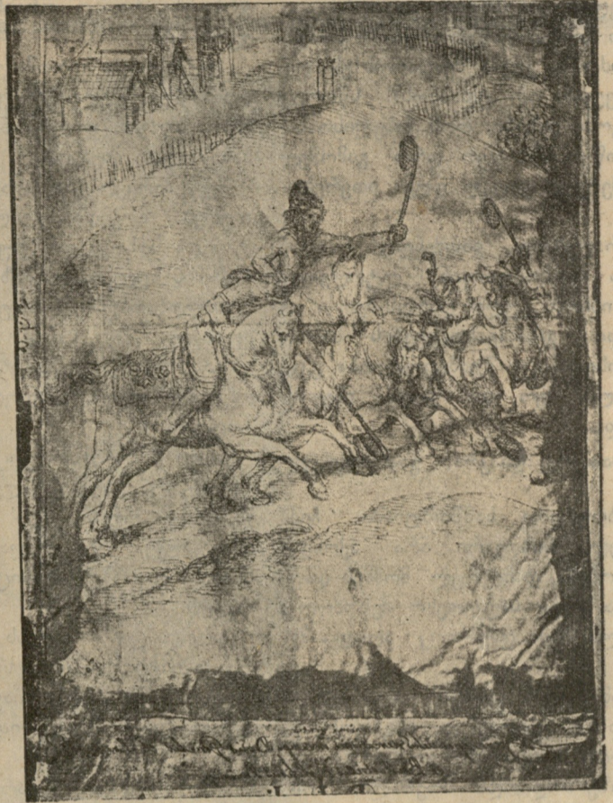
ბურთაობა ძველს საქართველოში.