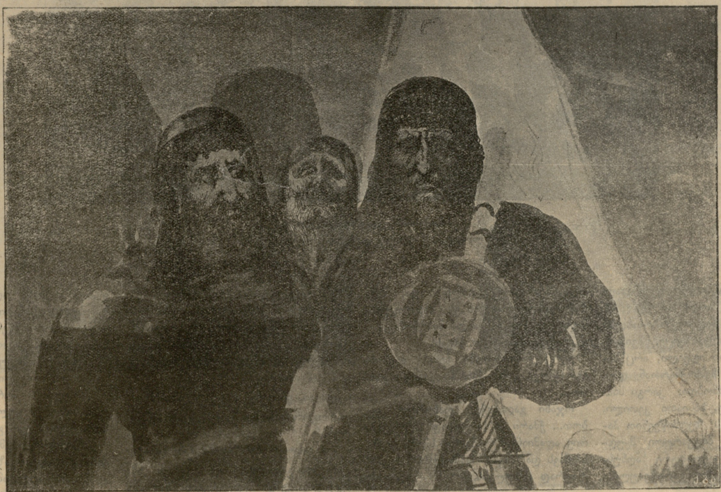
მელოზები (ვარიაცია მეორე) ნახტი ვლ. ს.—ერისთავისა.