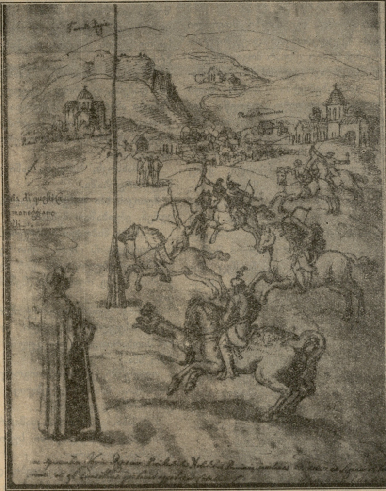
ქართველ ცხენოსანთა თამაში.