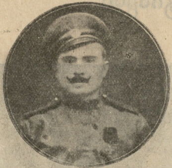
ივლიანე მეთოდის ძე უღნტი. გმირულად მოჰკლეს გალიც. ფრონტზე.