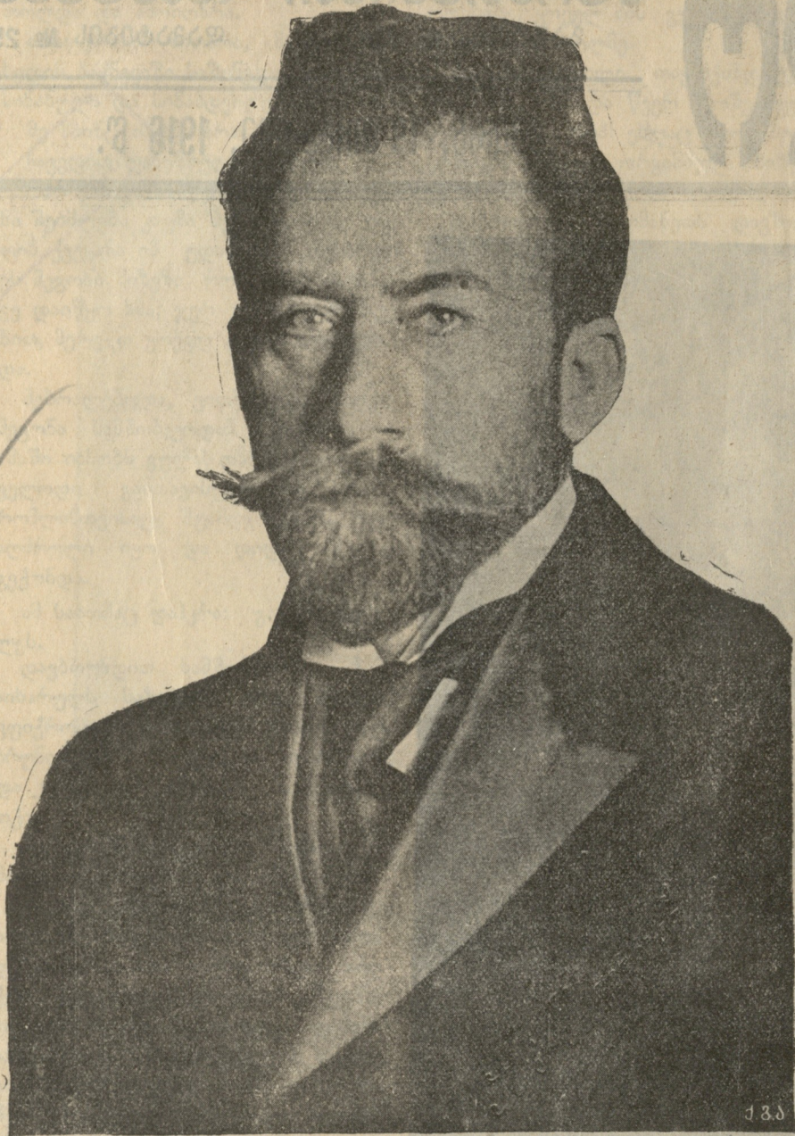
ლადო ღარჩიაშვილის უკანასკნელი სურათი. (ავადმყოფობით გარდაიცვალა გერმანეთში)