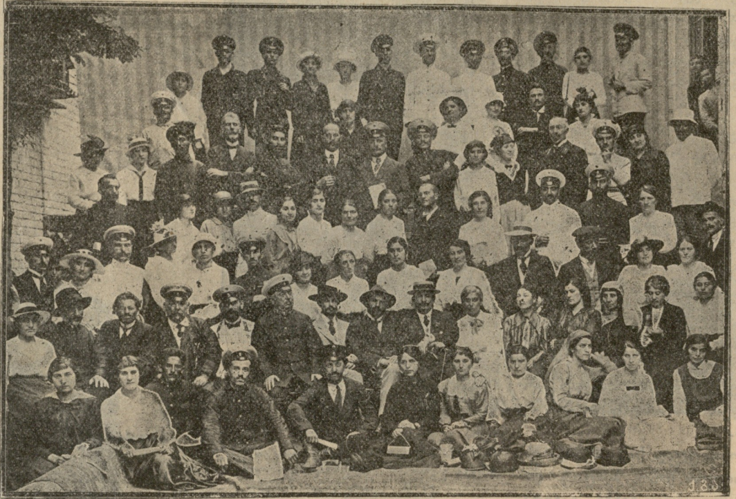
მასწავლებელთა ურლობა თბილისში.