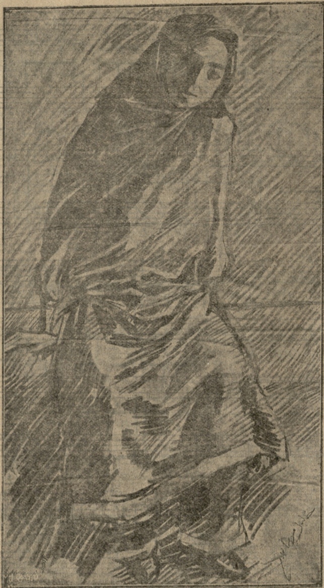
ლევინ ქალი ნახატი ხალილ ბეგ მუსაევისა.