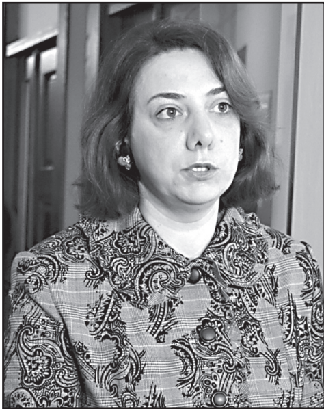
„ნატოზე უარი ნებისმიერ ხელისუფლებას ძვირად დაუჯდება“

– არა, ამას არ ვამბობ. რა თქმა უნდა, ეს ძალიან მნიშვნელოვანია, მაგრამ დღეს საქართველოს მოსახლეობის უმრავლესობას მიაჩნია, რომ ევროკავშირთან, ევროპასთან ურთიერთობის შესაძლებლობა იმიტომ არის კარგი, რომ მათ შეუძლიათ ლტოლვილის სტატუსი მოითხოვონ. შესაბამისად, არ მგონია, ასეთი ქვეყანა მიმზიდველი იყოს ვინმესთვის. ამიტომ, მაშინ, როდესაც ქვეყანაში შეჩერებულია ყველაწარმო ეკონომიკური განვითარება, გაუგებარია, რა რბილი ძალა უნდა დაუპირისპიროს