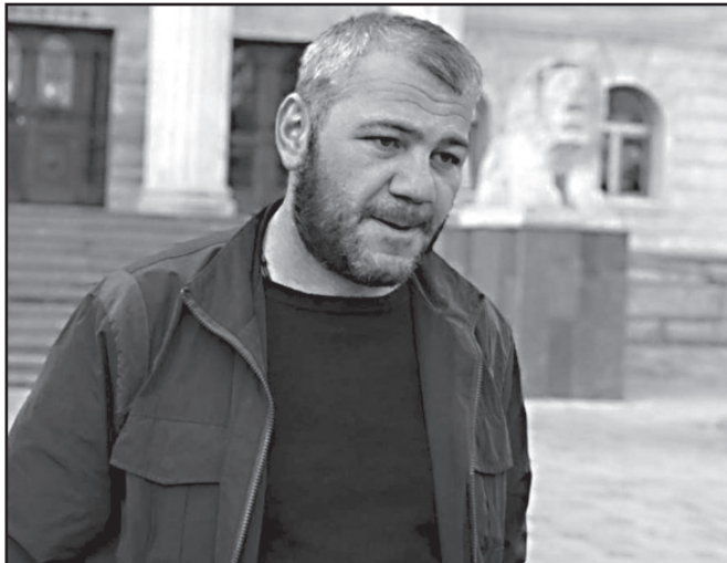
და თქვენს შვილს მართლა ეცემა და „აჩმორება“ ბორის შვილი შვილი, ეს ვერაფრით გაამართლებს იმას, რაც ხორავას ქუჩაზე მოხდა.

– სოციალურ ქსელში დაწერე, რომ თუ ბორის კაკუბავა მართალი აღმოჩნდება, მას, მის ოჯახსა და საზოგადოებას საჯაროდ ბოდიშს მოვუხდით. ჩემი შვილის მხრიდან „აჩმორებას“ მართლაც რომ ჰქონდა ადგილი, ეს ვერანაირად ვერ გაამართლებს იმას, რაც პირველ დეკემბერს მოხდა.