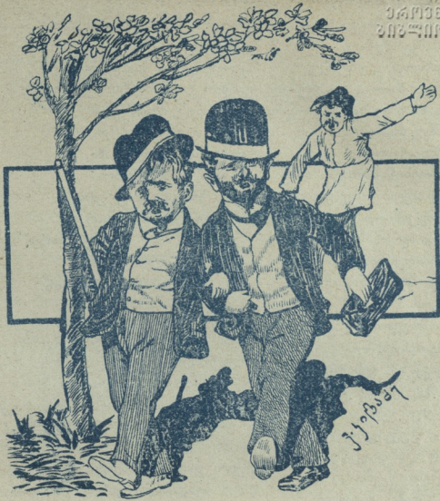
ჩვენი დროის დილომატები.