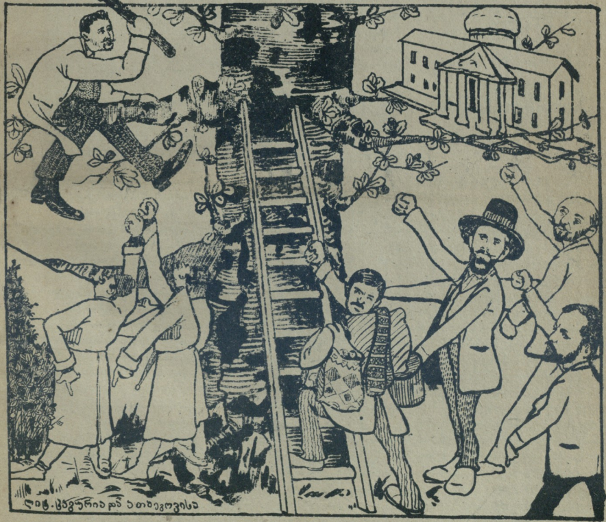
ლიტ. ცხენურიან და თბილისისა

უპანახსენელი ღმერთი. (დრამა 3 მოქმედებათ, თხზულება ვარლამ გელოვანისა).