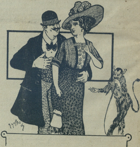
— ვინ დაეყრებს, რომ ეს თრნა, სეთი წუთის წინ ერთმანეთს სრუდად არ იგნობდნ!

ფულა და წკრადება გამოავზანებს ამ ადრესზე: Тифлиси, Типография Шрома, Теофили Болკვაძე.