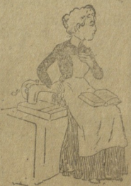
უწიბთეო ქალის მდგომარება.