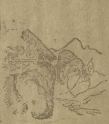
კაცი ფიქრობს ღმერთი სჯის.