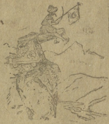
მალალი ალაგი თივლებია გამარჯვების.