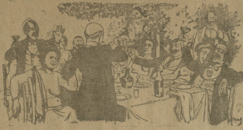
საქაშულიანების განცხროვა სააღდგომოდ.